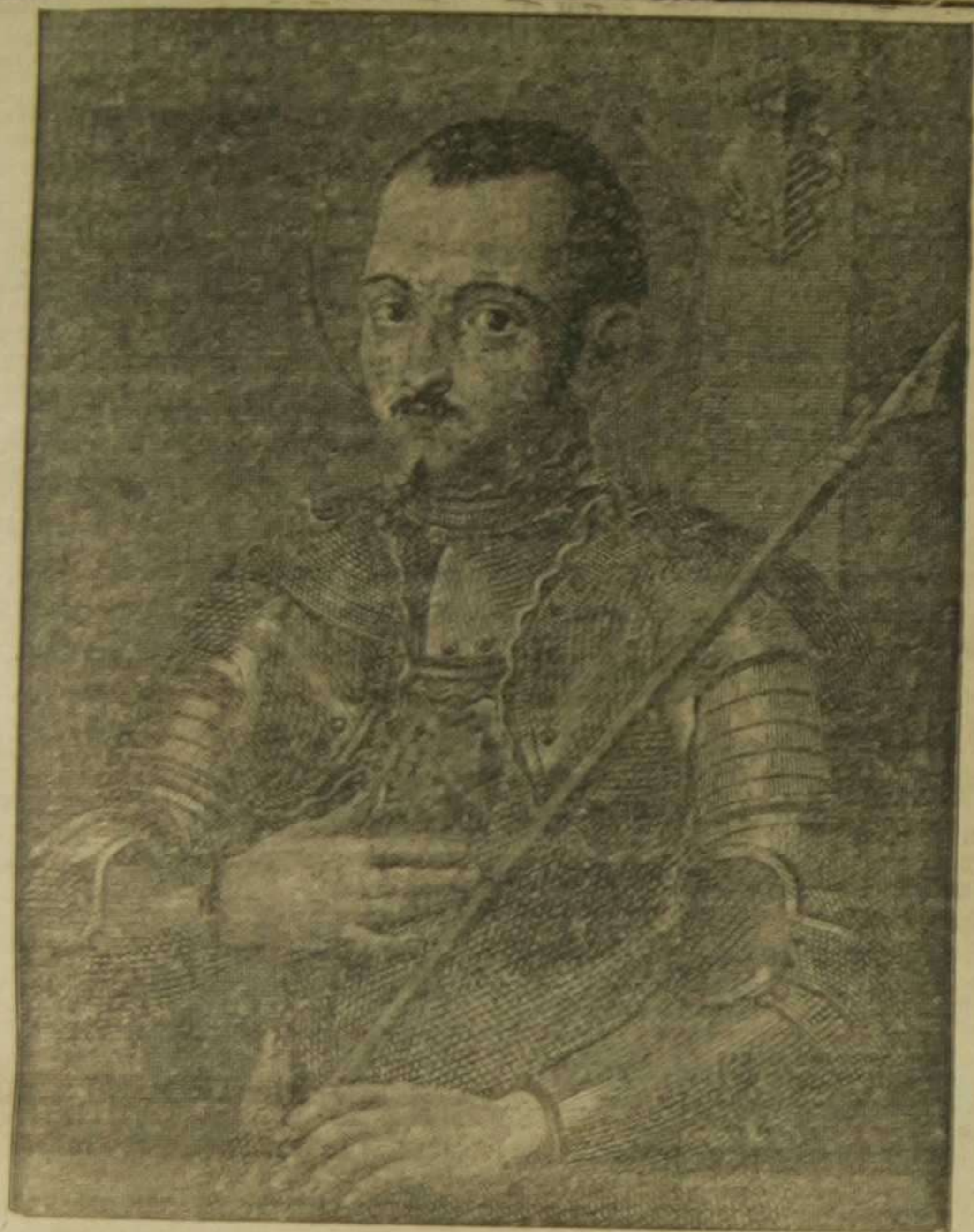
SAN IGNACIO DE LOYOLA, FUNDADOR DE LA INCLITA COMPANIA DE JESUS. Reproducción de un grabado en cobre, copia del célebre cuadro del Tiziano