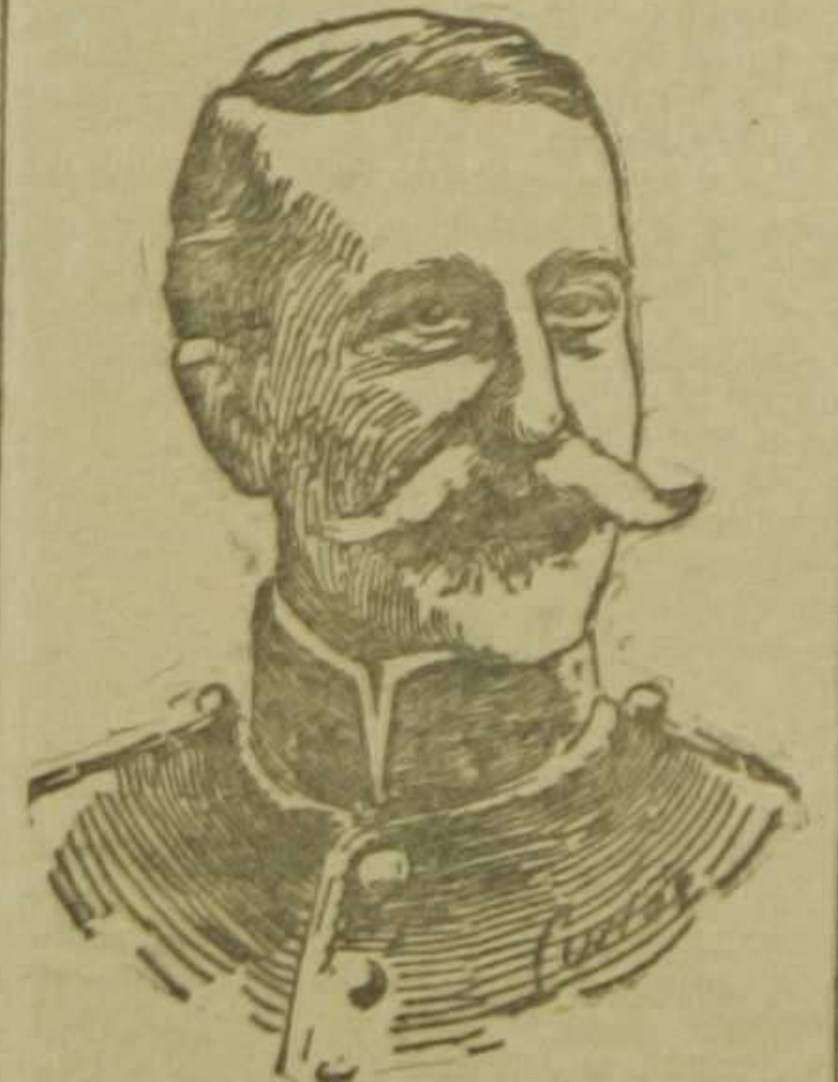
Marqués de Comillas

Comisario regio en la Exposición de Industrias Eléctricas de Barcelona