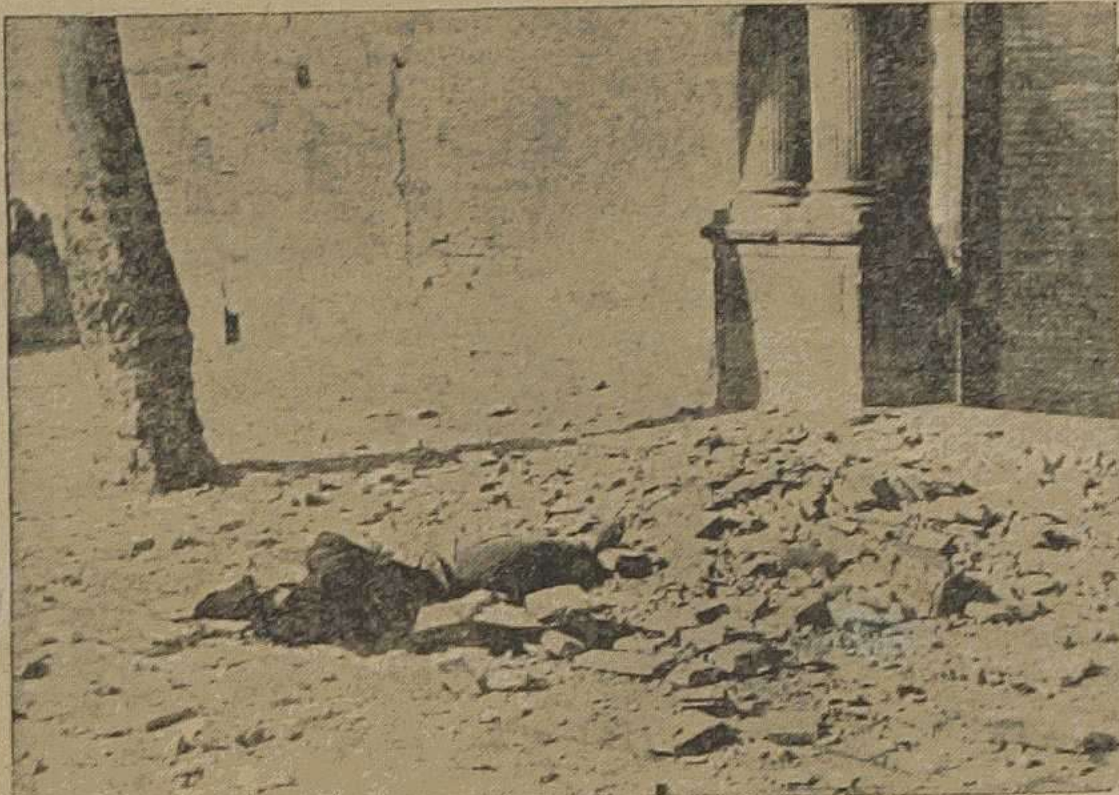
UNA DESGRACIA EN LA PLAZA DE SAN AGUSTÍN Lugar del suceso momentos después de ocurrir la sensible desgracia.

Un desprendimiento de ladrillos mata a una mujer en la plaza de San Agustín.—En Almusafes se derrumba el lavadero y resultan dos mujeres muertas y cinco heridas