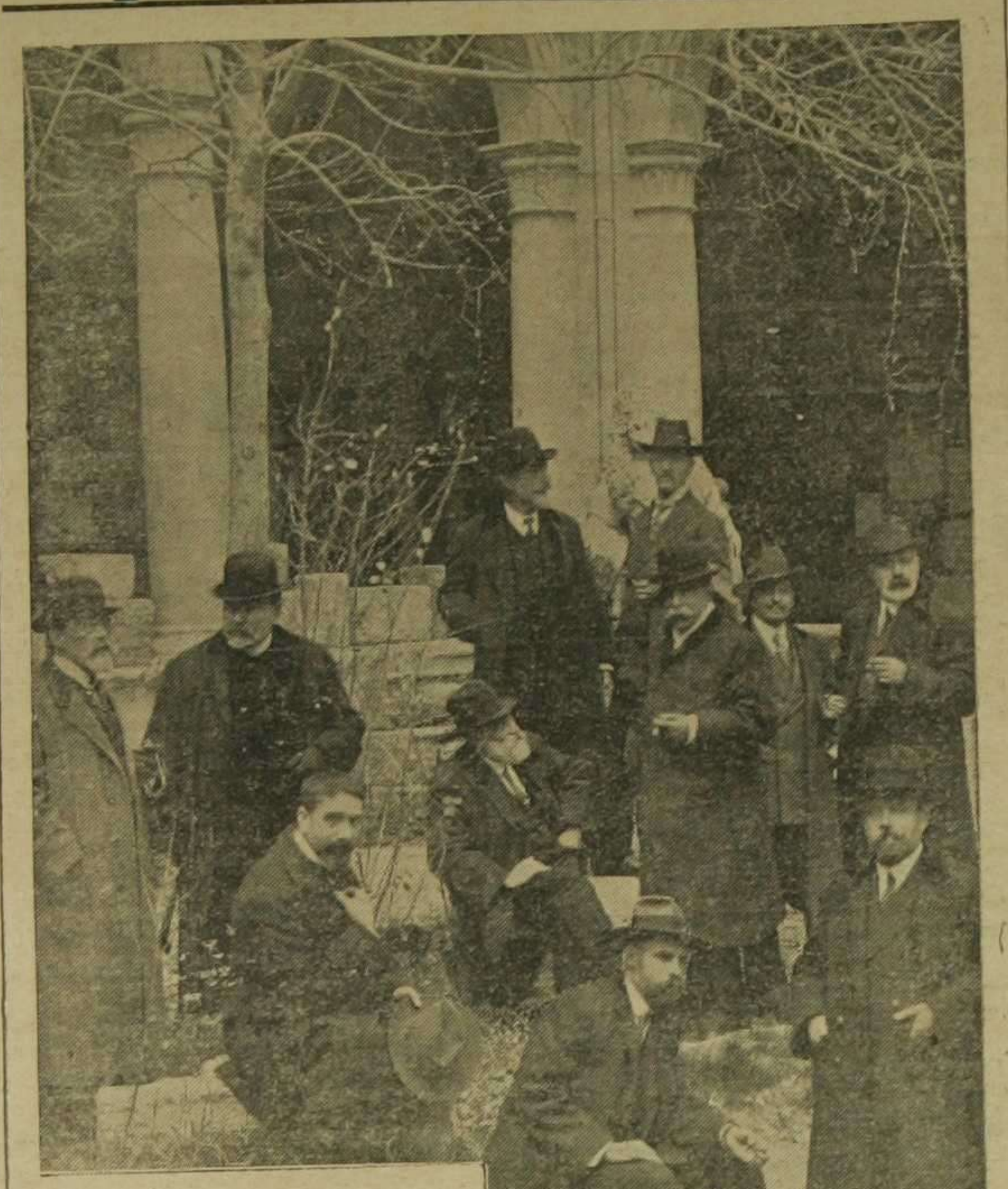
Claustro de profesores de la Real Academia de Bellas Artes.