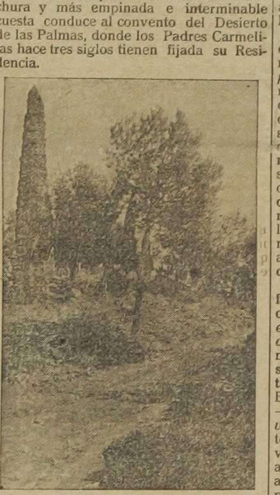
Desierto de las Palmas.—Camino del convento.

Montamos en nuestros dóciles arres y bien pronto dejamos la carretera para tomar el camino que en enjerevasda derecha y más empinada e interminable cuesta conduce al convento del Desierto de las Palmas, donde los Padres Carmelitas hace tres siglos tienen fijada su Residencia.