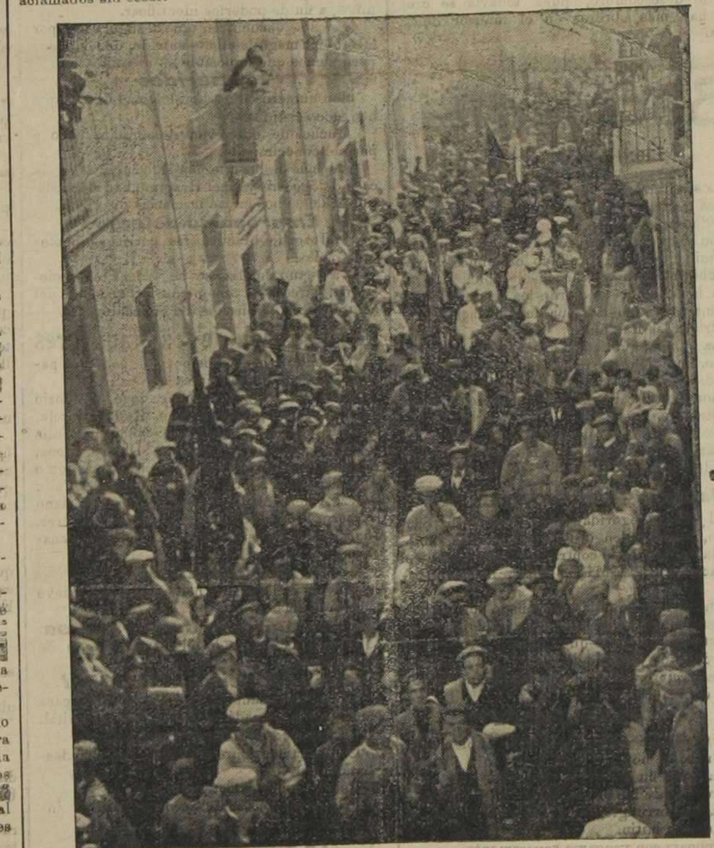
Aspecto de la manifestación jaimista al pasar por una de las calles de Paterna