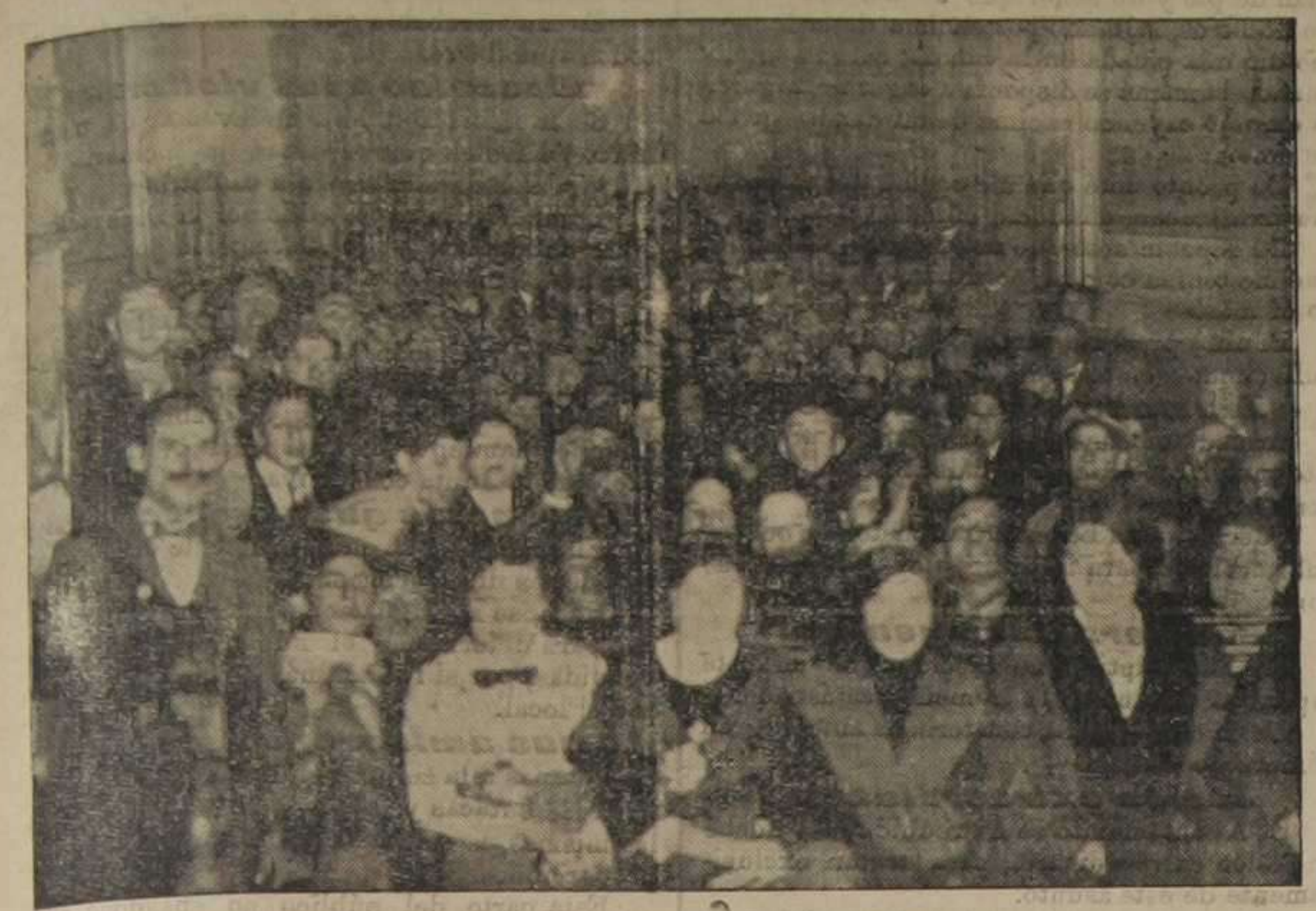
Aspecto de uno de los salones laterales del Círculo Central durante la valada que nuestro Requeté celebró anoche.