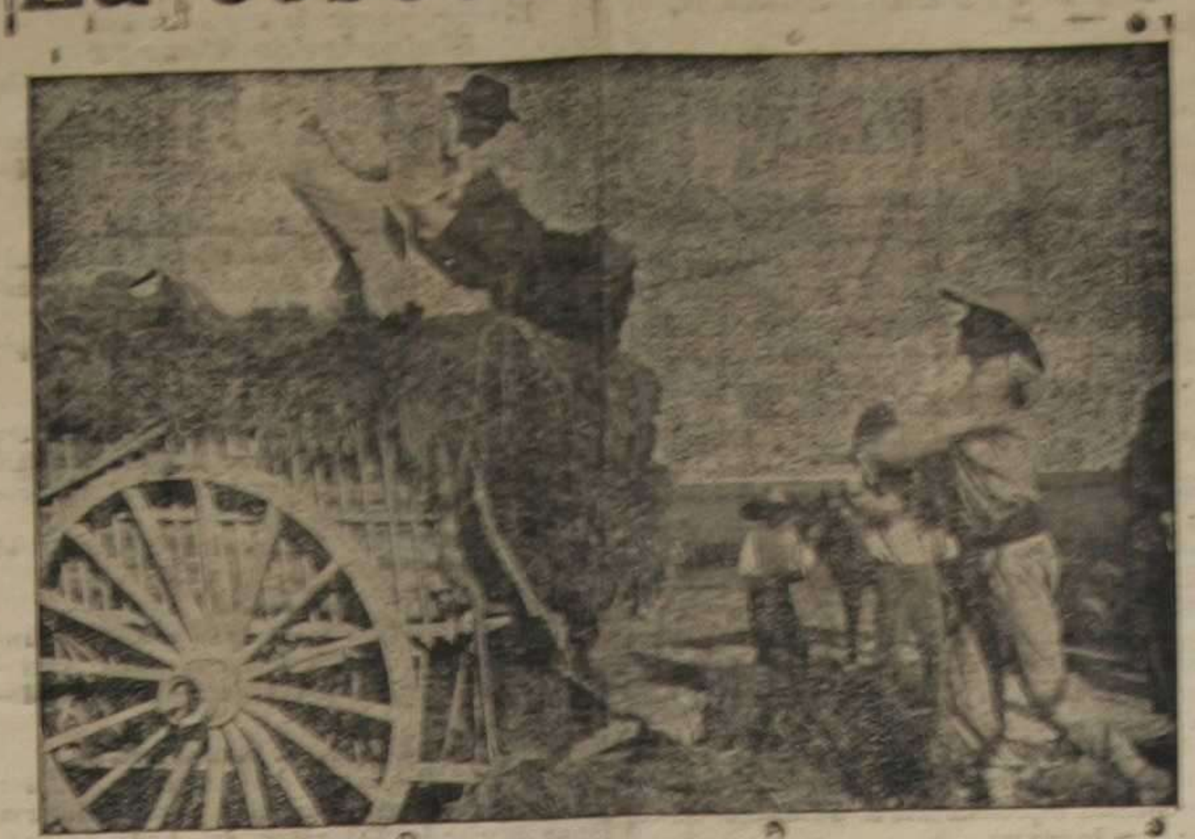
Cargando gavillas en un carro