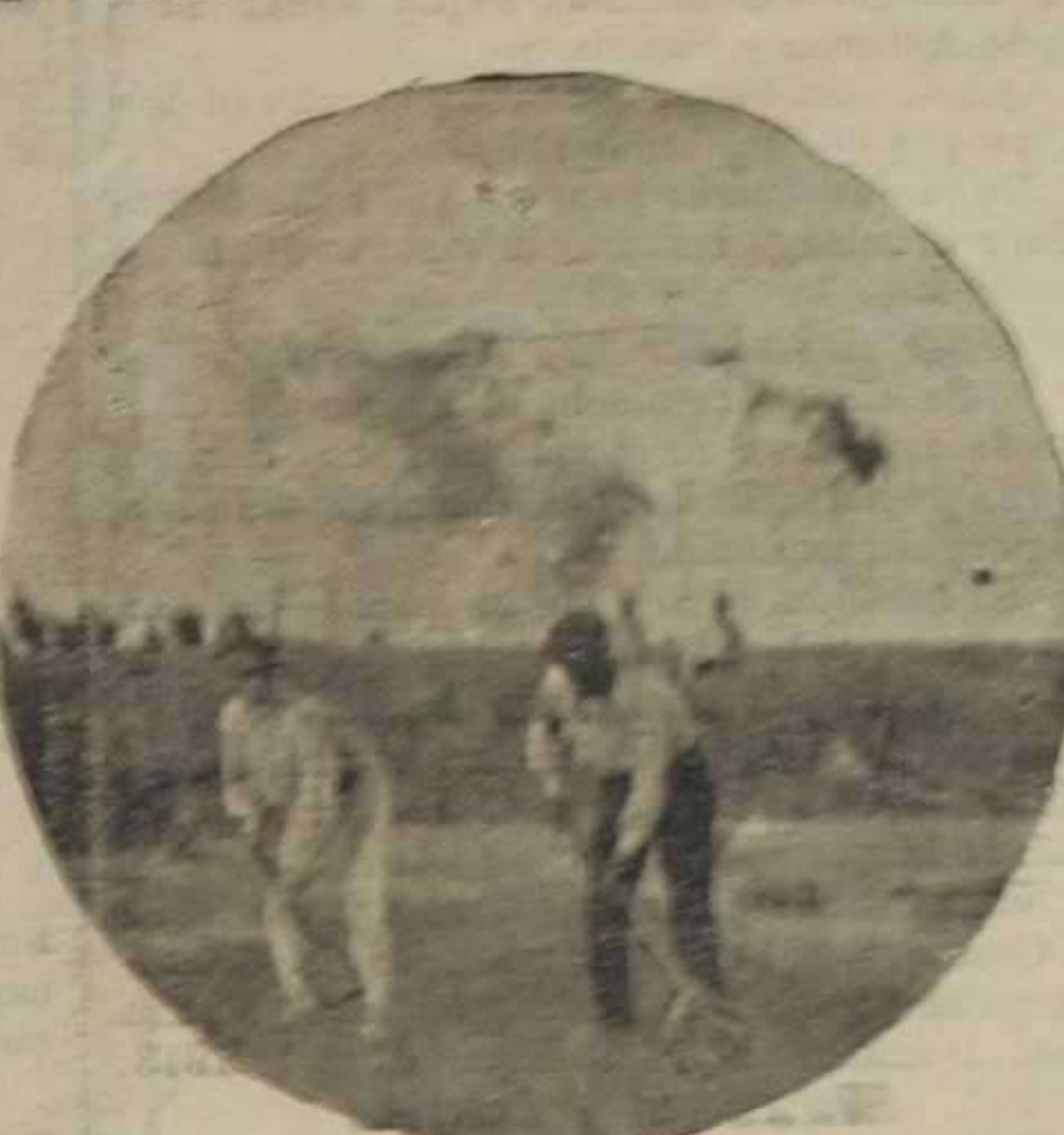
Removiendo el arroz durante el periodo de la siecha