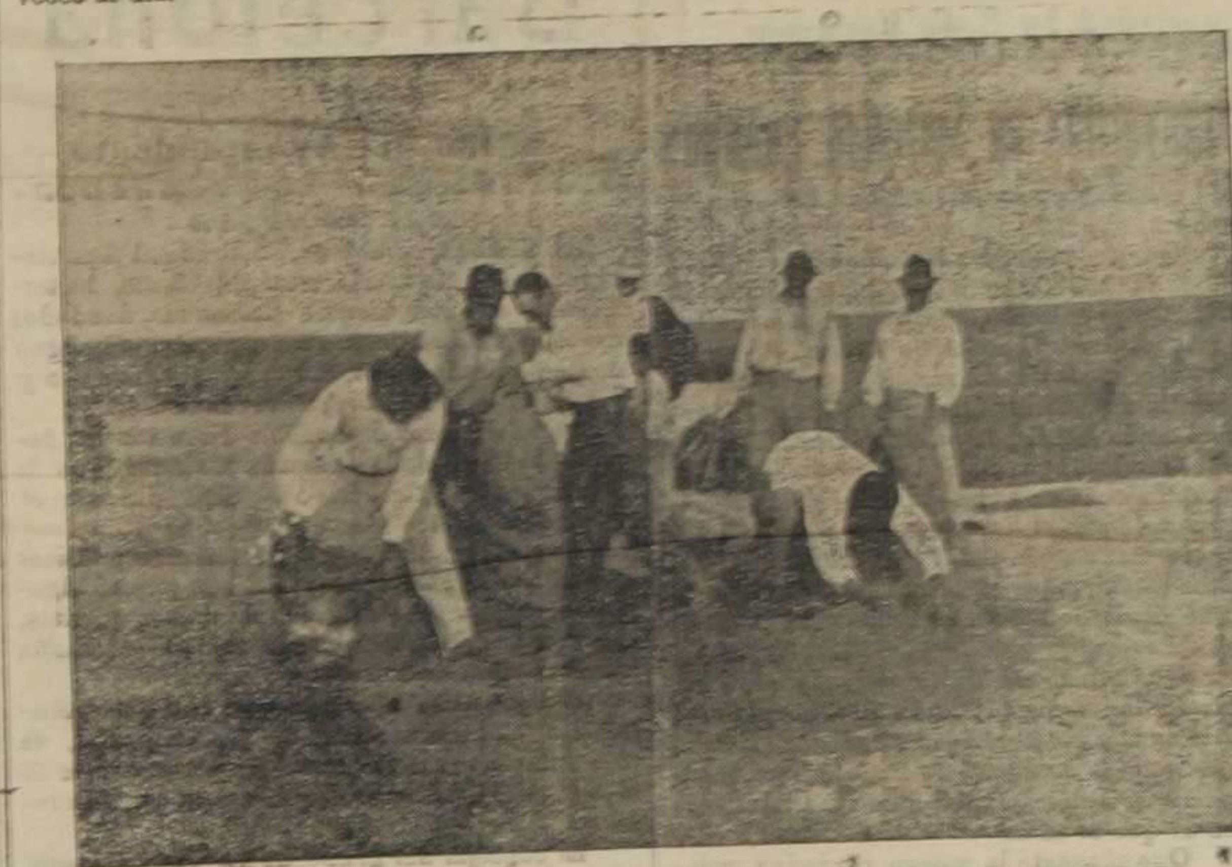
Envasado del arroz. (Información gráfica de Martín Vidal)