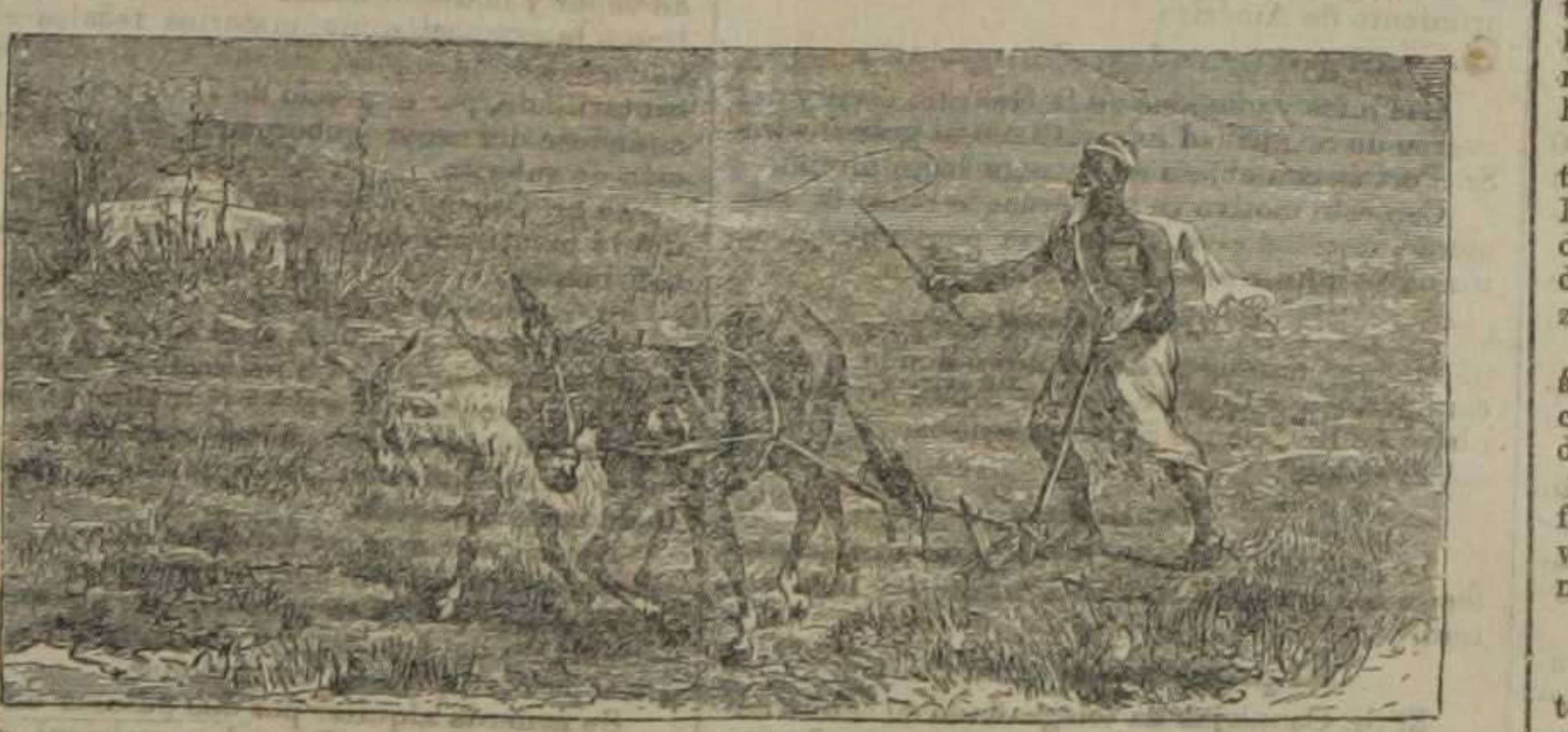
Tipos y costumbres de Marruecos.—Las faenas agrícolas

Relación de las bajas.—Entusiastas felicitaciones al heroico Ejército que pelea por la Patria