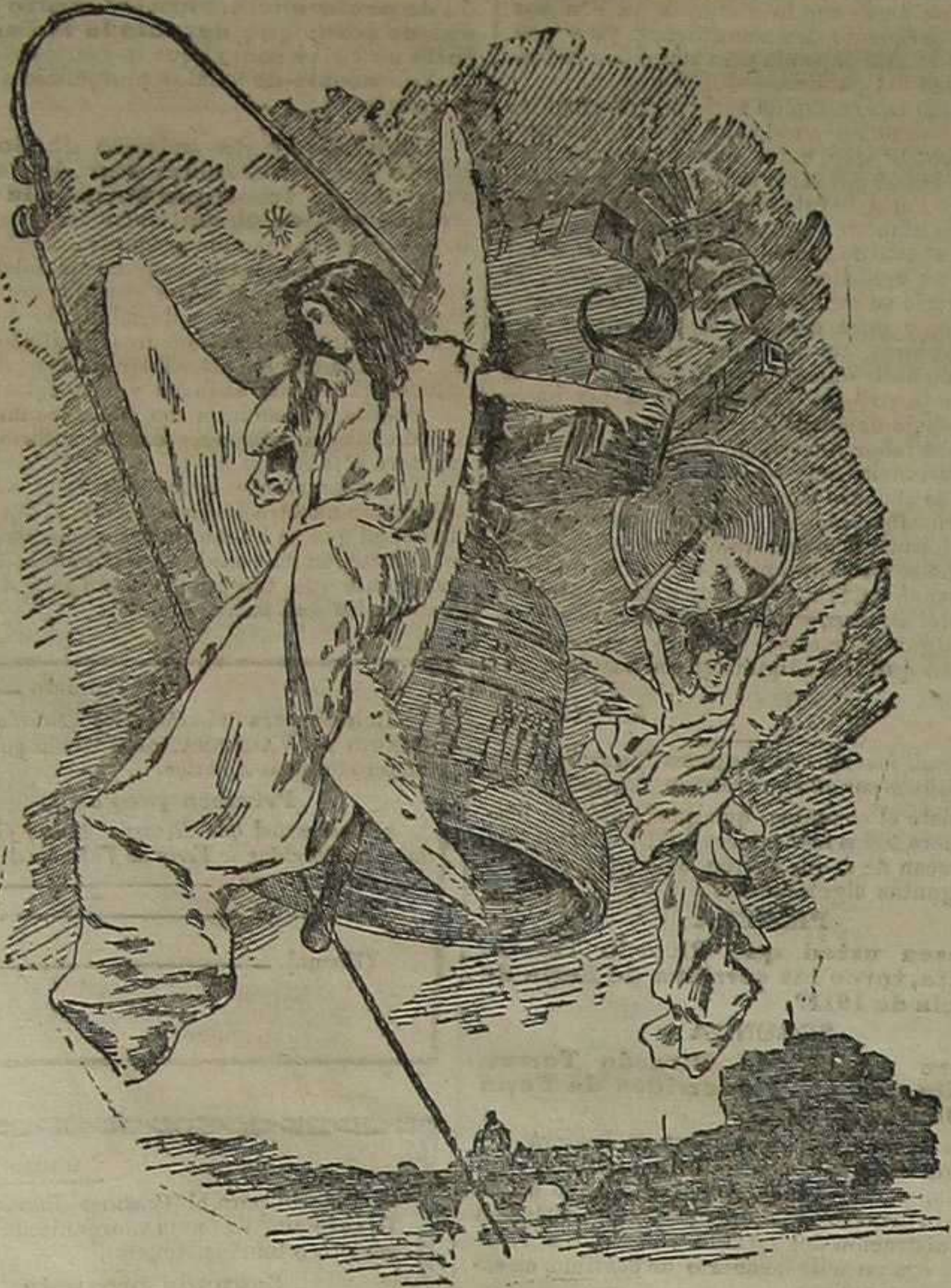
Alegoría del Sábado de Gloria.