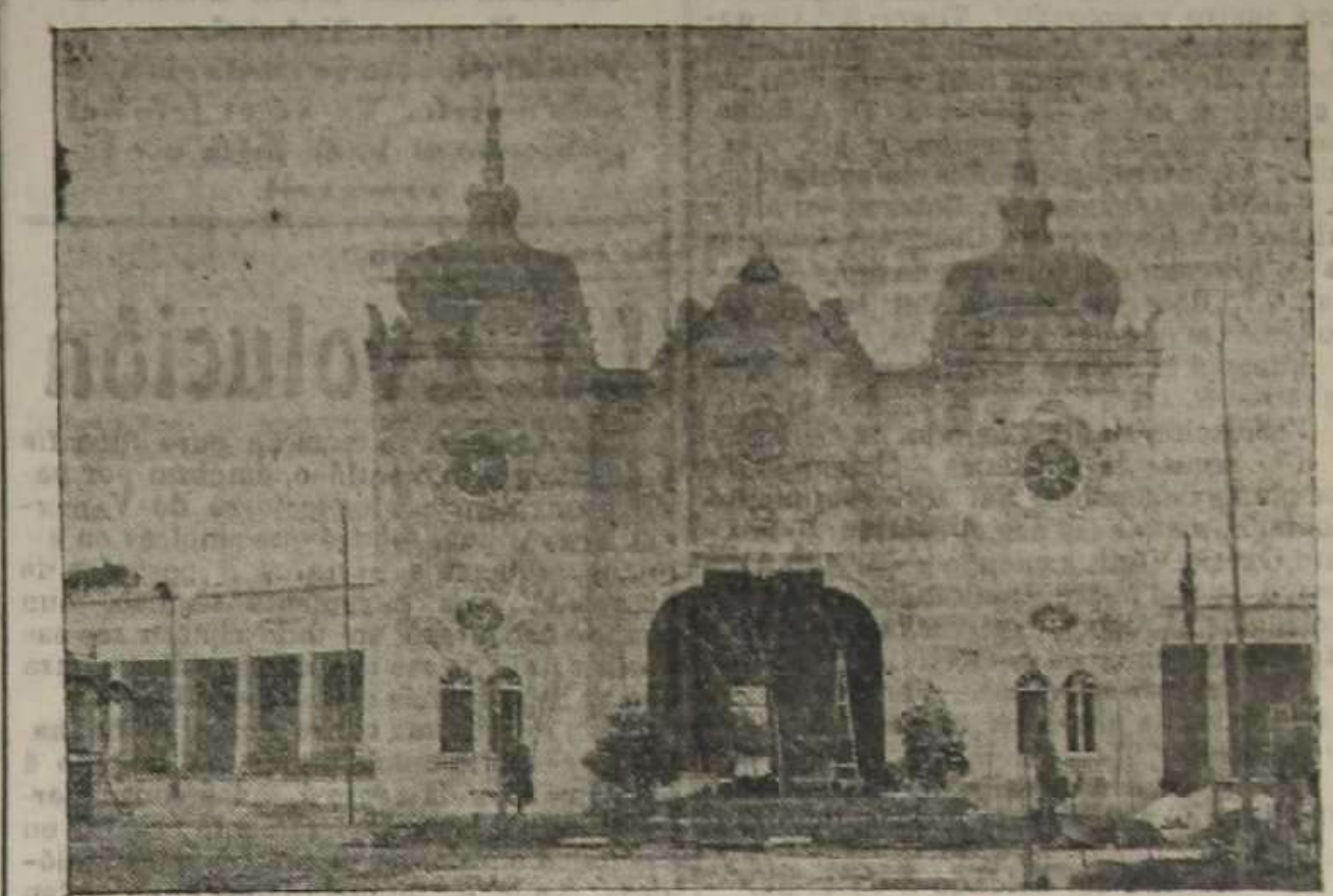
Palacio de Agricultura

Palacio de Agricultura El Instituto de Reformas sociales denunció á los obreros que, infringiendo la ley del Descanso dominical, trabajaban en la construcción del arco de la plaza de Emilio Castelar? Si no lo ha hecho puede hacerlo todavía.