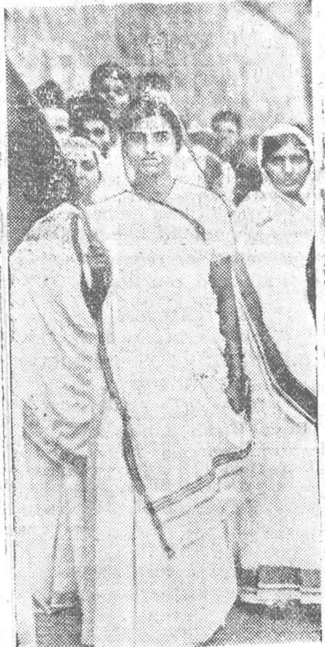
La señora Nehru dirige el movimiento por la Independencia en Bombay