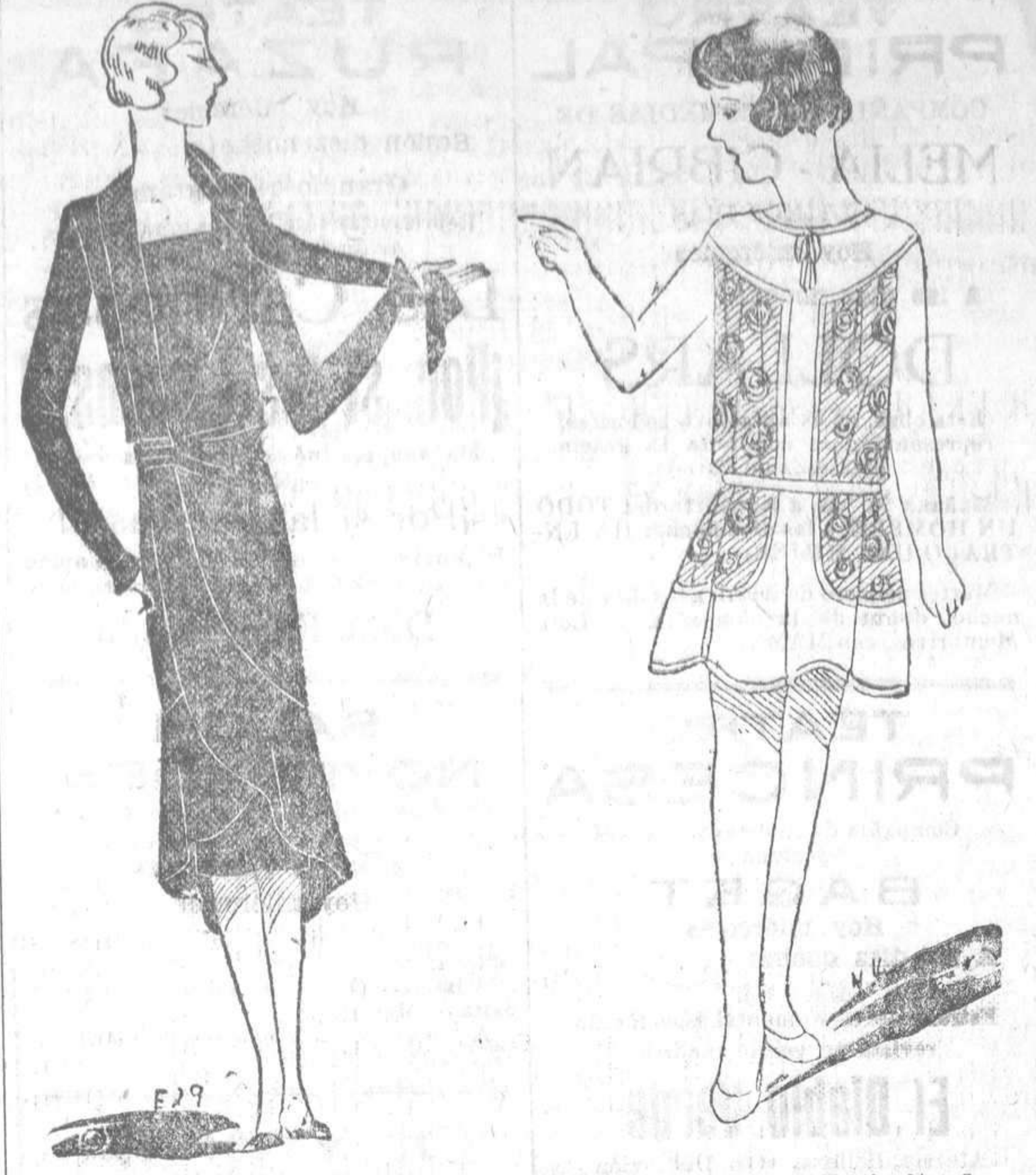
Vestido de terciopelo negro, con un volante en forma.—Trajecito de tul bordado en blanco y crépe liso

Hace seis años arancó de la estación del Grand Central, de Nueva York, un tren con destino a