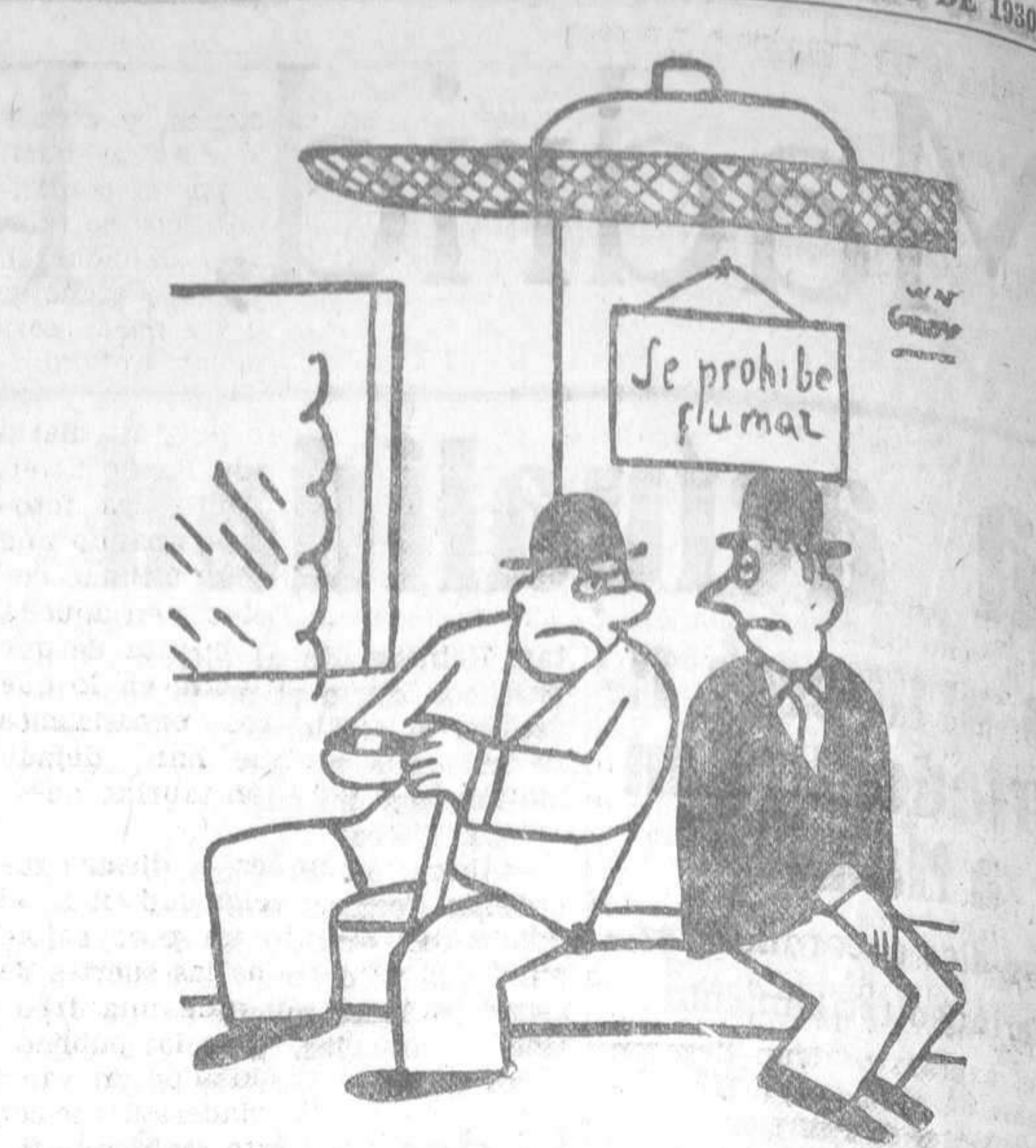
—¿Le molesta el humo, joven? —Cuando no tengo cigarros, sí.

Obreros Carpinteros La Unión. — Se convoca a junta general ordinaria para el martes, a las seis de la tarde, en el domicilio social.