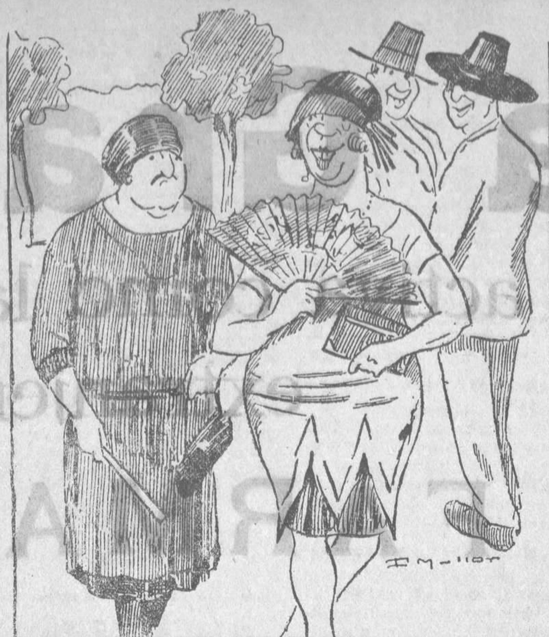
—Yo no lo niego, mamá. Me gusta que me llamen guapa. —Hija, pues a mí no me gustan las mentiras...

Continúa la boga de los escotes con ribetes de bordados o pasamanerías de cuentecitas brillantes. Estos collares incrustados se prolongan por la espalda, sirviendo de adorno de ésta. Pero hay que advertir que estos adornos no se acomodan a todos los vestidos: están reservados a los vestidos de crepé de China y otros crepés, de color oscuro, azul marino, color de castaña o color negro.