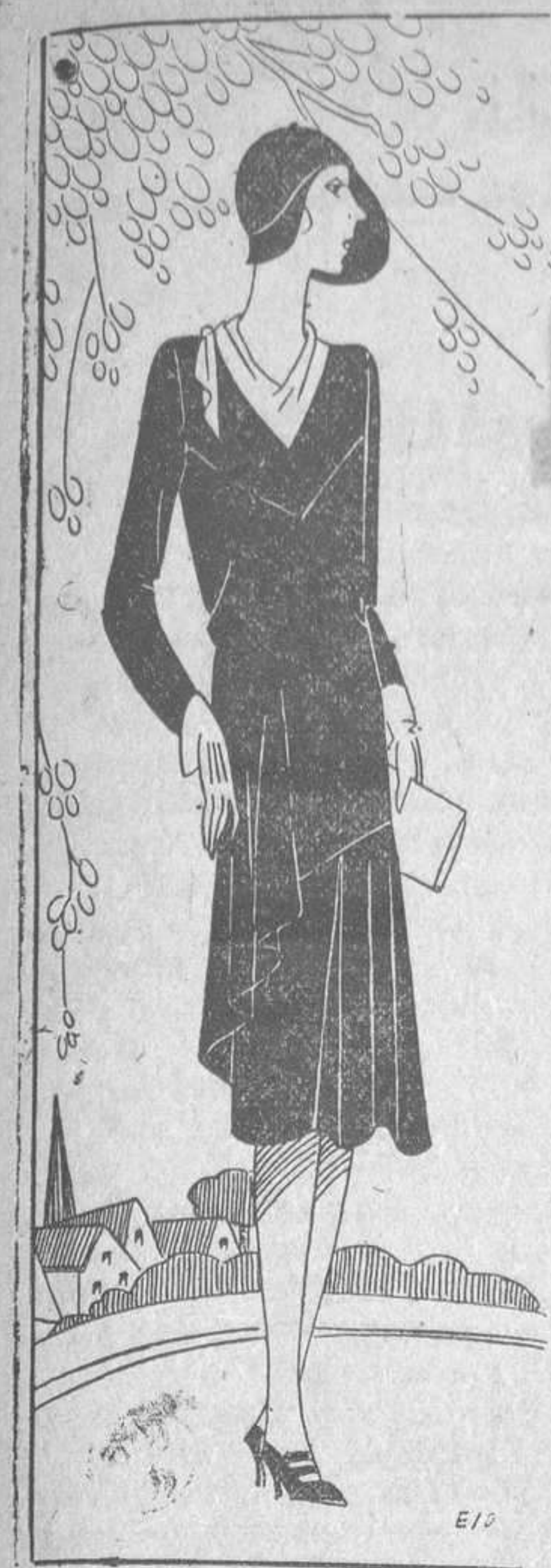
Vestido en crepé rojo, con falda a godets. En el cuello, pequeño fichú incrustado de crepé blanco.