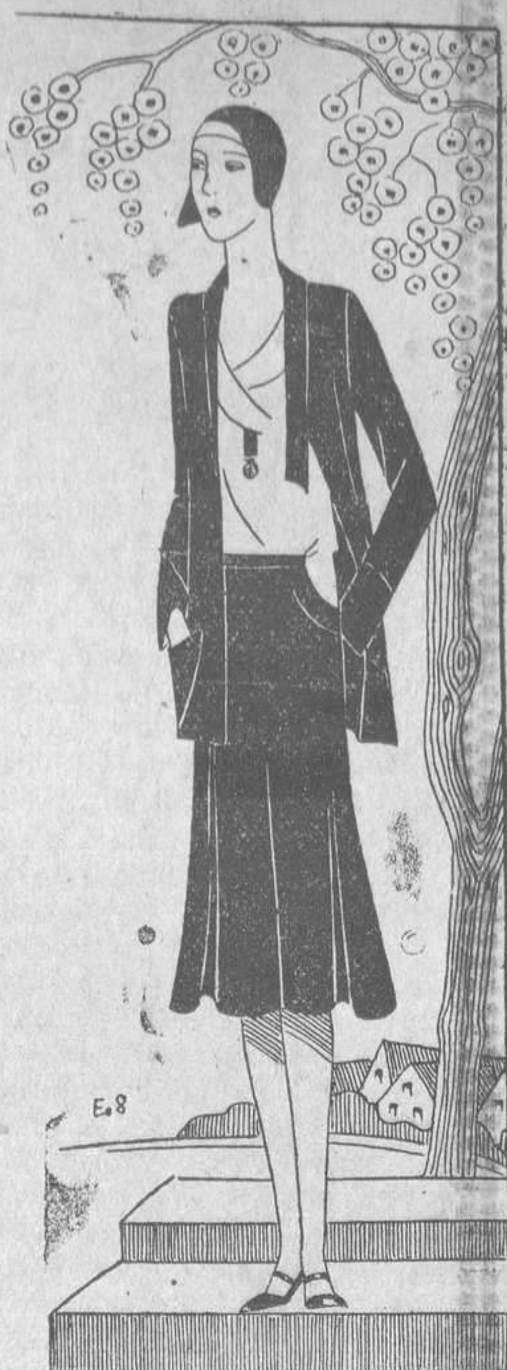
Tailleur en jersey de lana marina, con falda a godets, sobre una blusa de crepé de china azul claro.