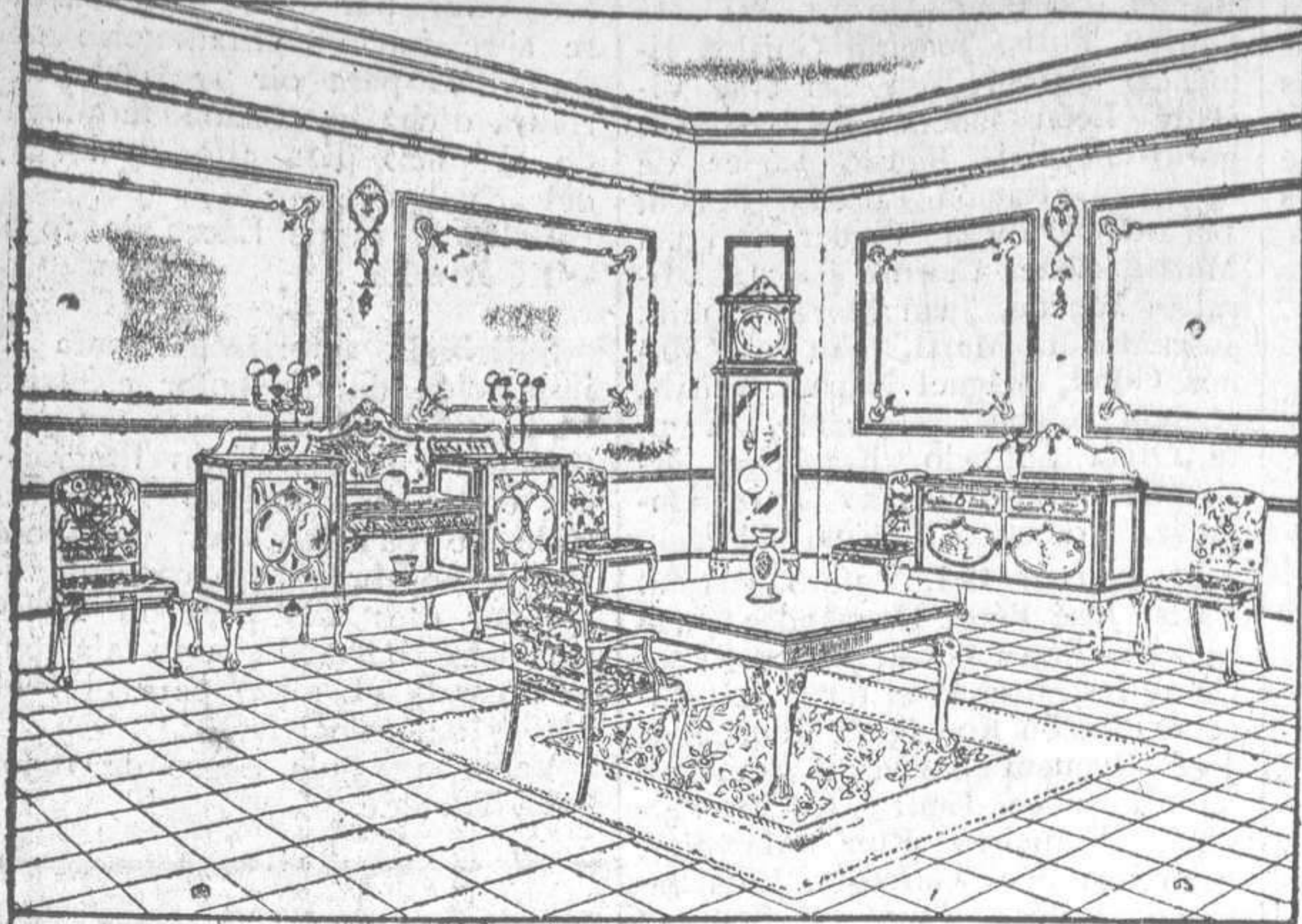
Ventas a fecha fija sobre toda clase de mercancías dando facilidades de pago hasta tres años