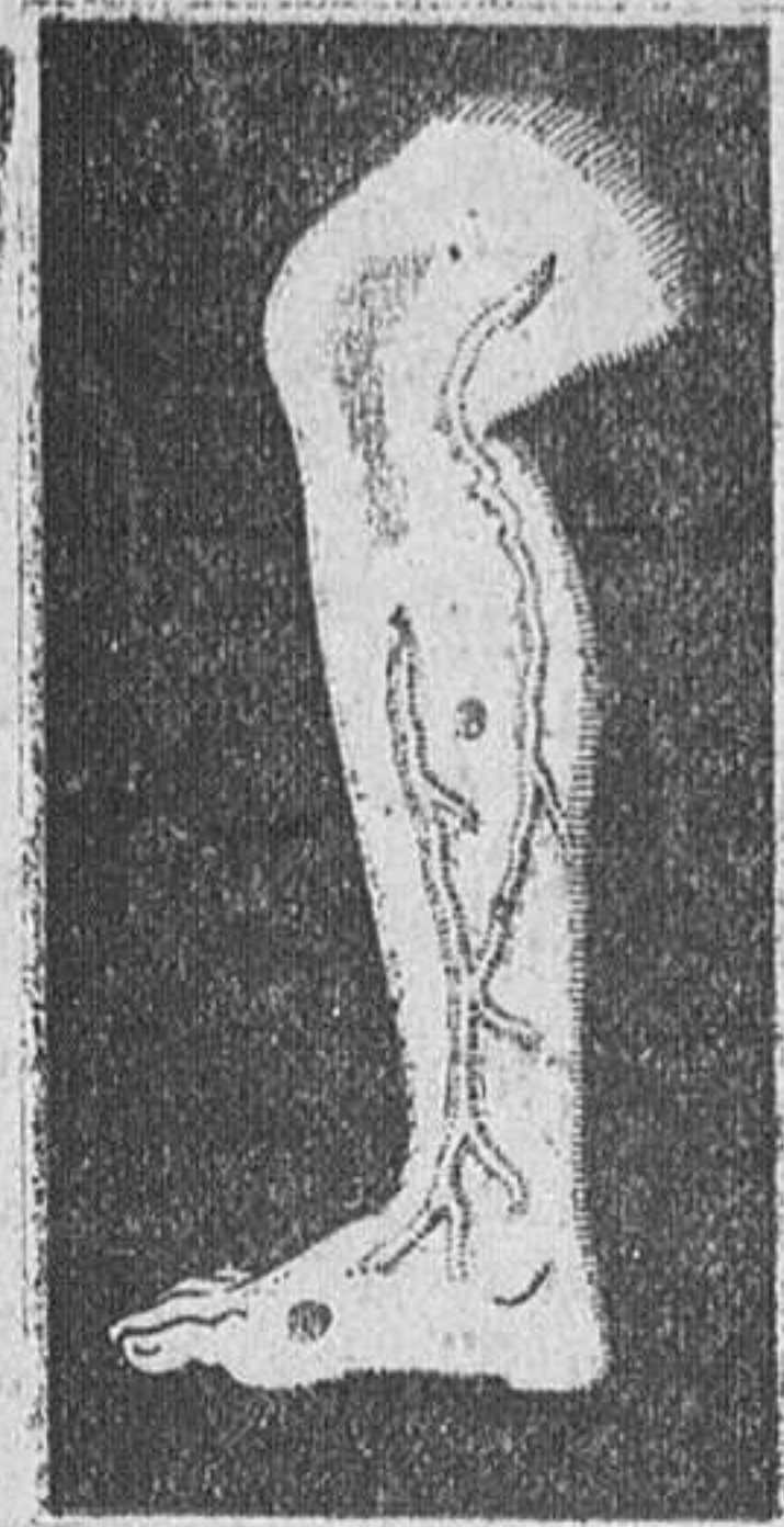
Pierna con varices

Grandes colecciones en modelos fantasía para señora y caballero