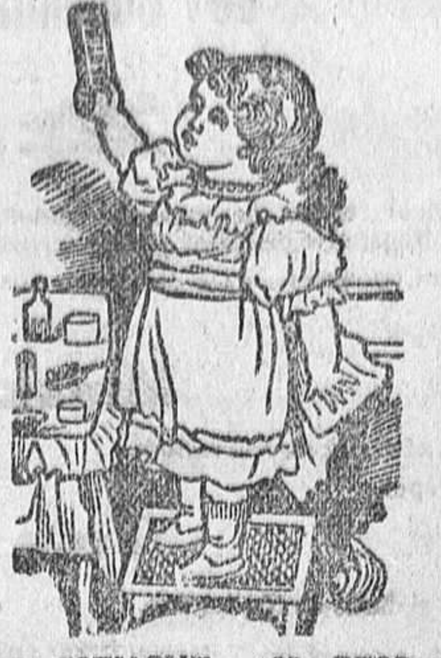
CAJA-ESTUCHE, 1,25 PSETAS