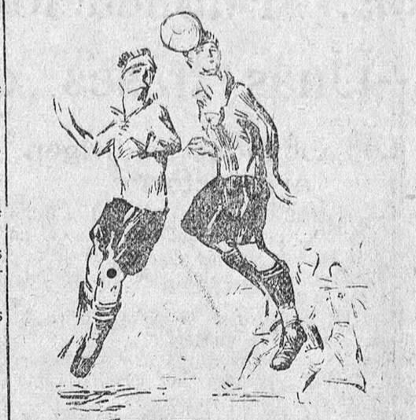
Molina jugando de cabeza

Desde luego puede afirmarse terminante de este hombrerico casi liliputiense, que siempre inclinado su cuerpo menudo y la cara y brazos casi á ras de tierra, da la impresión de que corre á gatas con una celeridad inverosímil.