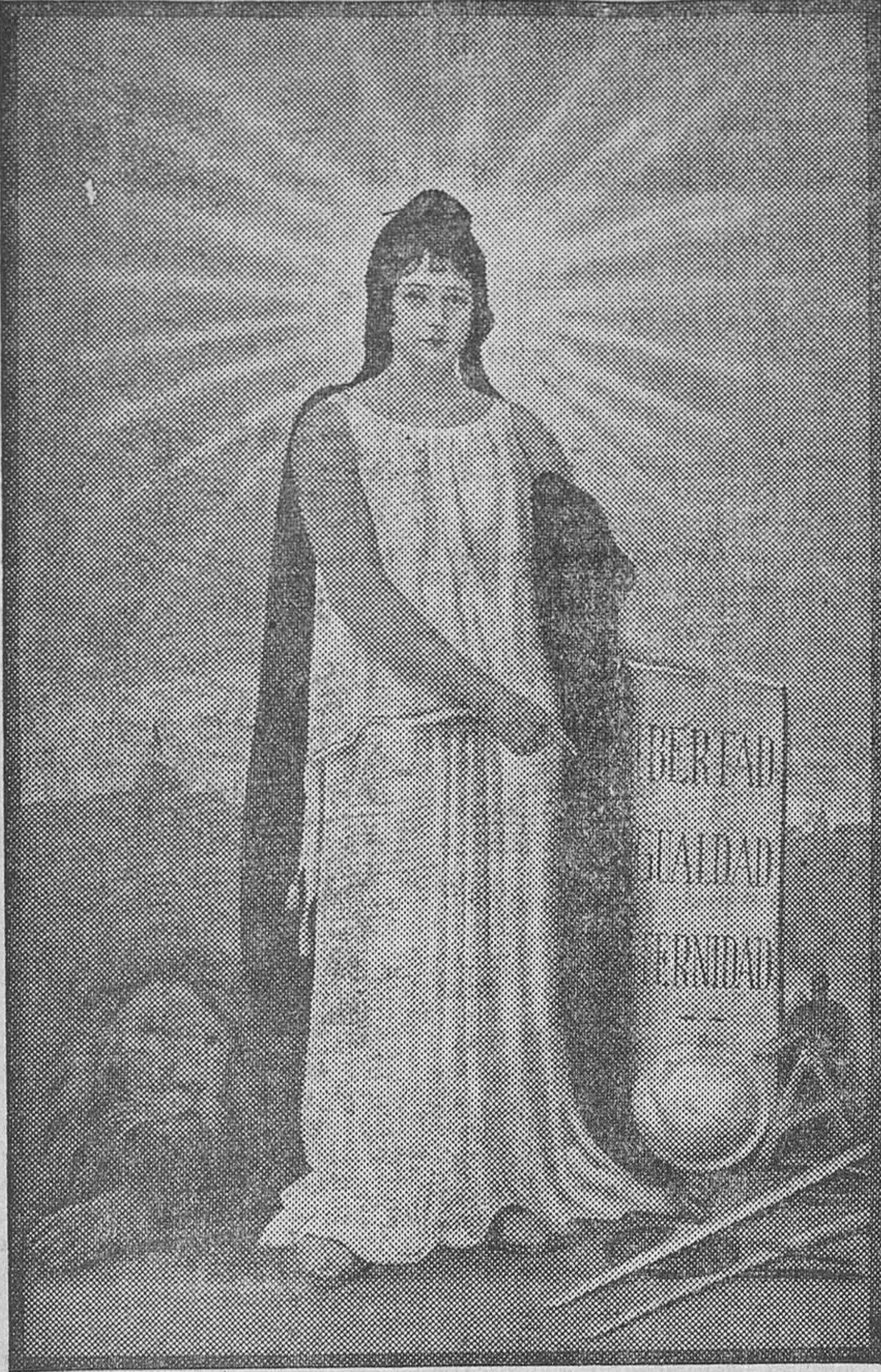
Tamaño 77 por 110, ocho ptas.; tamaño 54 por 84, seis ptas.

La alegoría más indicada para ayuntamientos, diputaciones, juzgados, oficinas del Estado, centros republicanos, etc., etc.