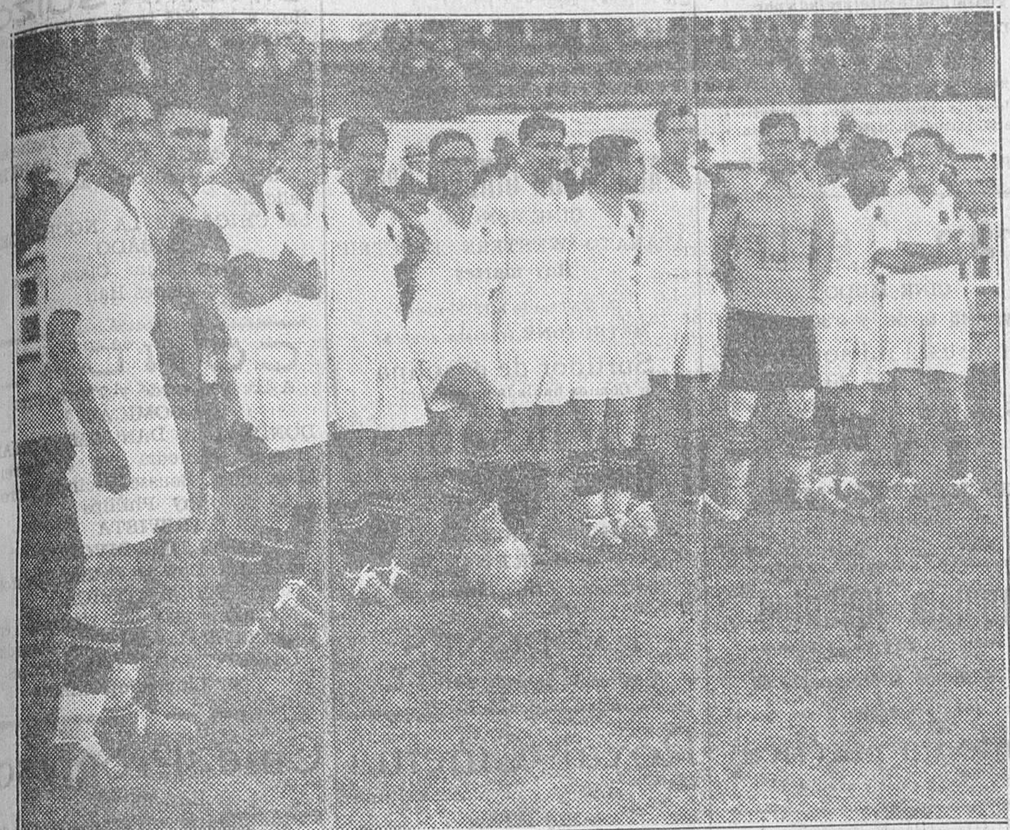
El equipo del Valencia F. C., clasificado como campeón regional

El "score" de uno a cero no refleja la marcada superioridad del Valencia. --- Una admirable lección de deportividad del público y jugadores valencianos