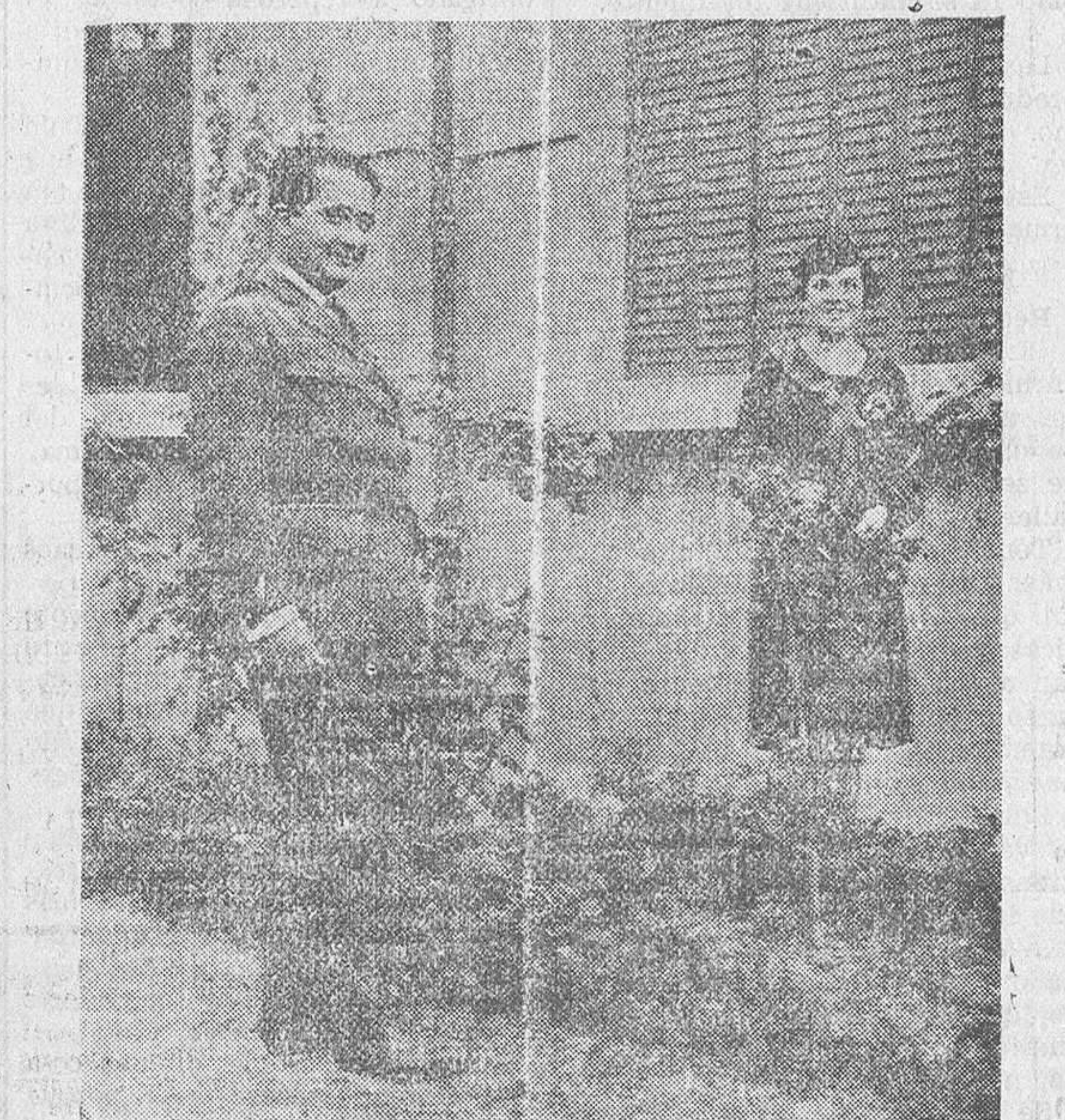
El heroico comandante Franco, con su esposa, antes de ingresar en prisiones militares, donde se hallaba cumpliendo el arresto de diez meses, impuesto por el Gobierno de Berenguer.