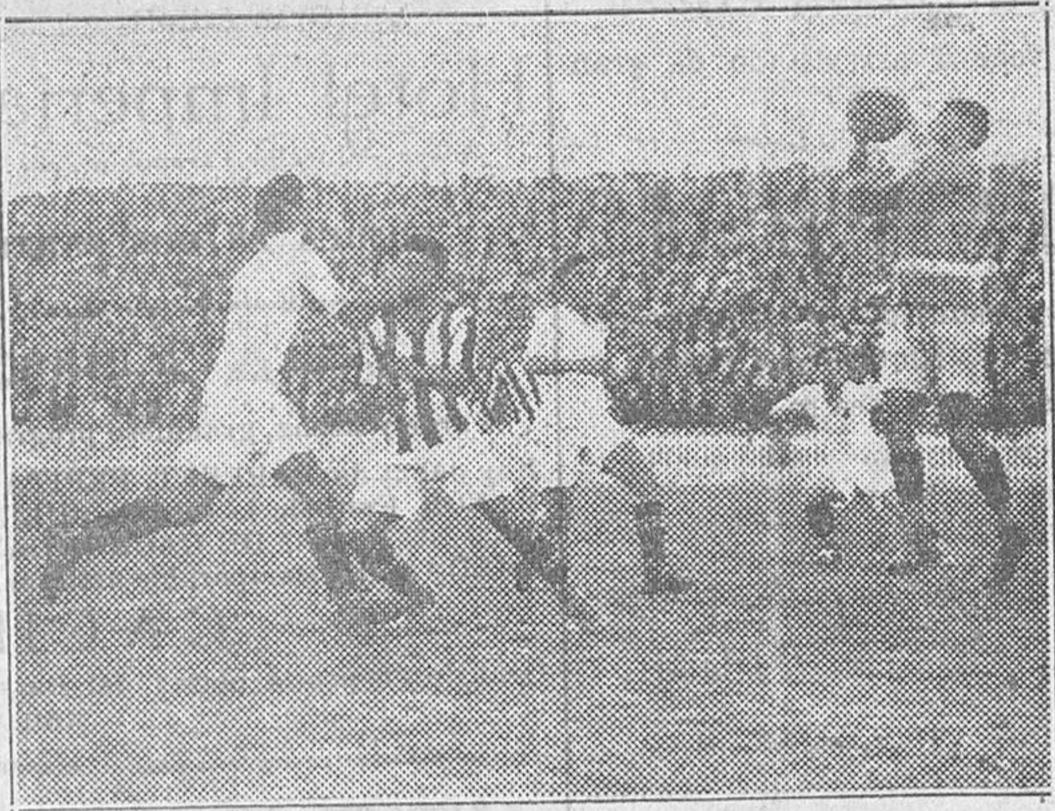
El Valencia en pleno ataque

do este ligero desoñamiento un tiro de Arróniz que dió en el larguero. Los blancos volvieron al ataque, y un remate cruzadísimo de Navarro no se coló en la red por menos de un cabello. En medio del interés general, Melcón señaló el fin del encuentro, del cual salía campeón regional el Valencia F. C.