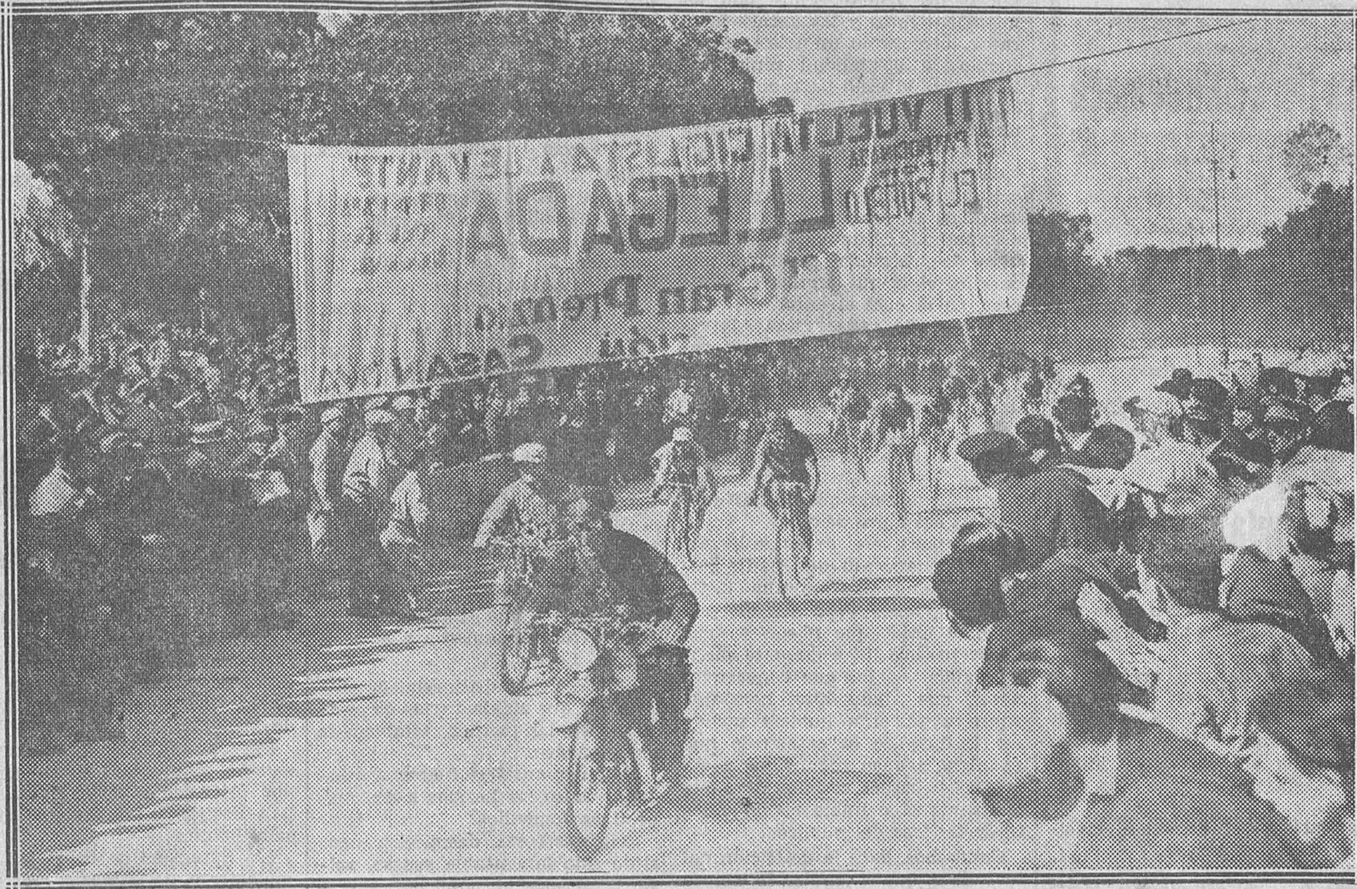
Instante grandioso en que entre delirantes ovaciones llegan a la meta los triunfadores de nuestra carrera, ante la expectación de los miles de espectadores que acudieron a su arribo, que aumentó en brillantez al del año pasado.

to—y cuente usted que hablo de esto siempre con un gran pudor—, pienso y siento que ésta es la hora de la Revolución. Durante la dictadura hubo muchas ocasiones; las ha habido desde Febrero acá muy oportunas. Ahora creo que se aprovechará la primera circunstancia favorable.