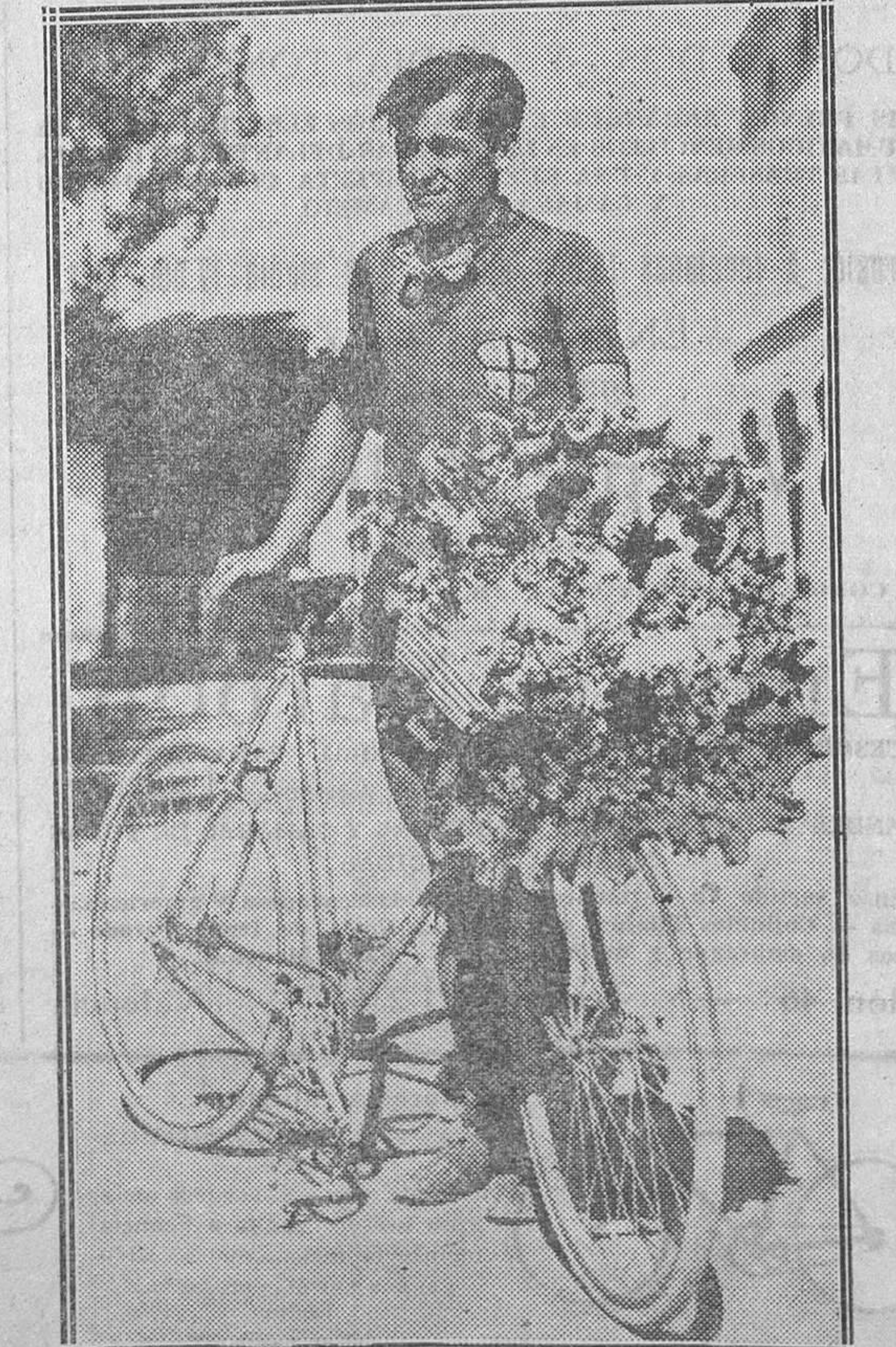
El héroe de las más grandes carreras ciclistas de España, una vez más demostró su pujanza, triunfando como siempre

vuestras cubiertas y cámaras en Colón, núm 50 Se garantizan todos los trabajos de reparación que efectuamos No equivocarse: COLON, 50