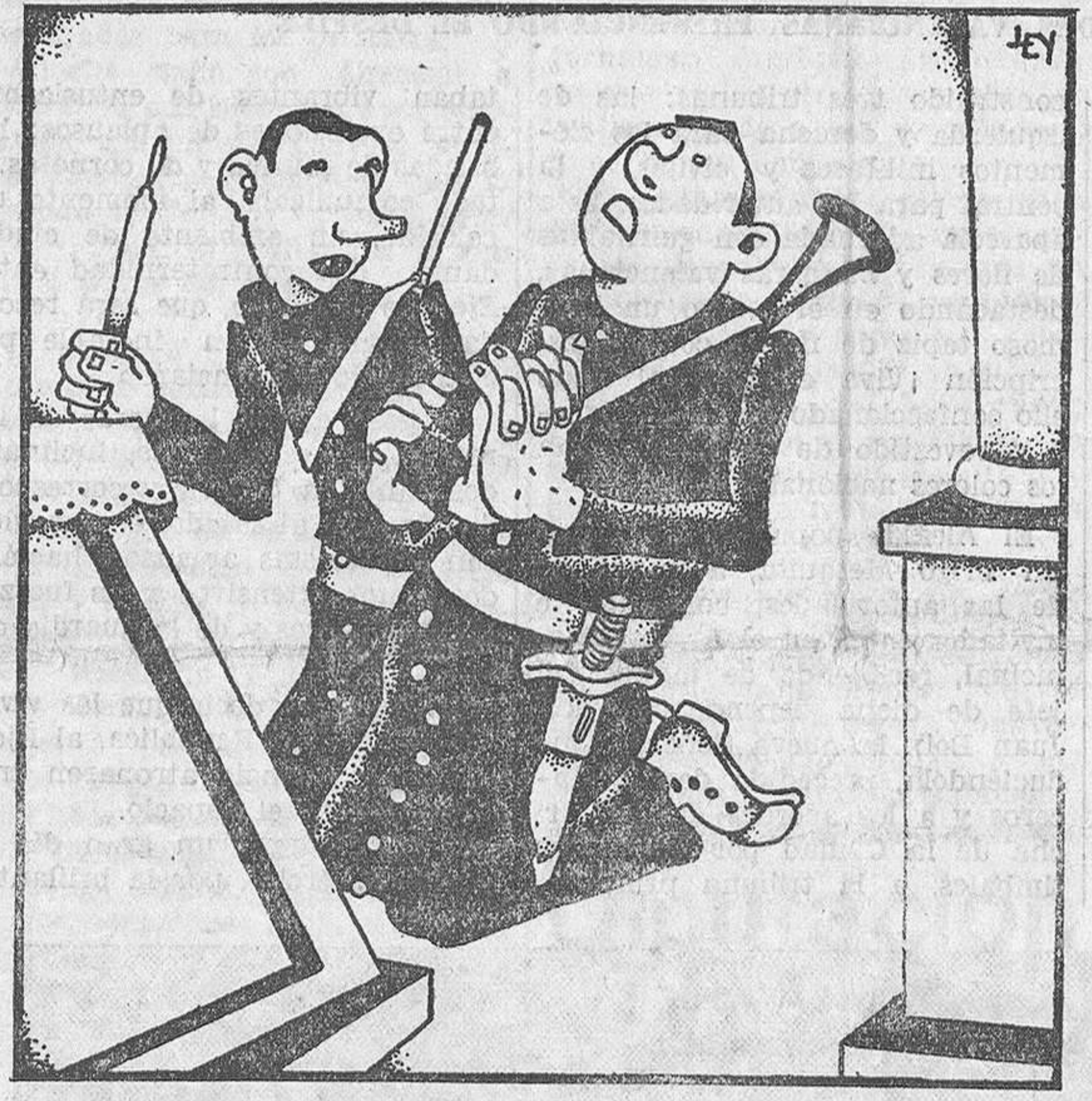
«El Nuncio ha ordenado que mientras dure el debate en el Congreso, se hagan rogativas para la paz espiritual de España y se implore la protección del cielo.» (De los periódicos.) —¡Roguemus para que nos proteja el cielo! —Y si no nos protege... prepararemos los trabucos.

capaz de demostrar la superación de sus aptitudes sobre los varones.