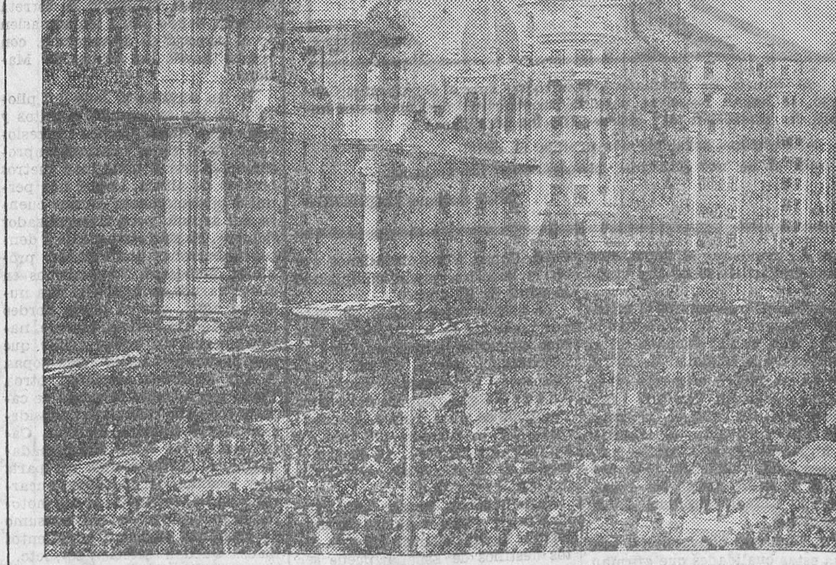
ASPECTO DE LA AMPLIA PLAZA DE EMILIO CASTELLAR DURANTE EL DESFILE DE LAS TROPAS.