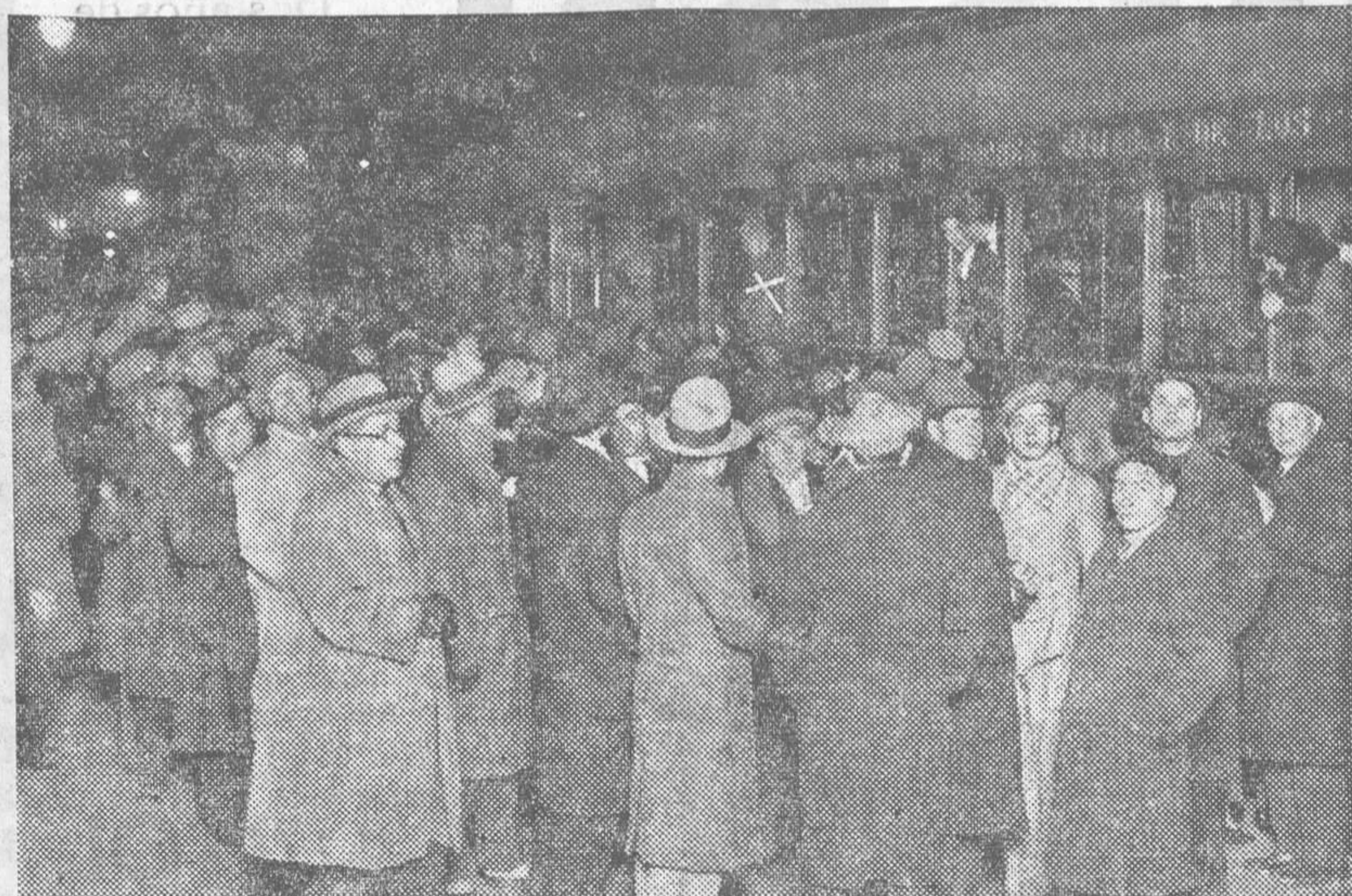
EL PARTIDO DE UNION REPUBLICANA AUTONOMISTA ACUDIO A LA ESTACION A DESPEDIR AL EX GOBERNADOR CIVIL SEÑOR RUBIO, OFRENDANDOLE SU SIMPATIA COMO UNA REPARACION POR LO INJUSTO DE SU SUSTITUCION EN EL MANDO DE ESTA PROVINCIA