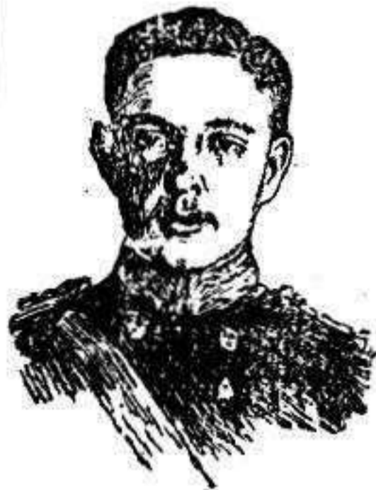
D. Manuel II de Portugal

mer augurios fundamentados en los planes de nuevo regicidio sorprendidos días antes por la policía, no se vieron turbados el respeto y la consideración que á to-