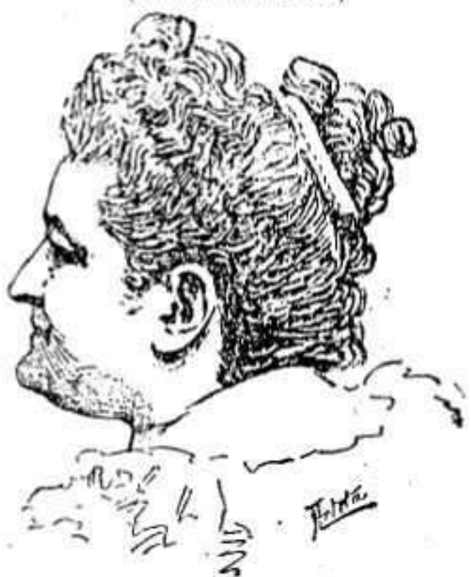
Doña Emilia Pardo Bazan

La eximia escritora Doña Emilia Pardo Bazan, acaba de enriquecer la larga serie de sus obras, labor literaria no por lo numerosa inmensamente notable, con un nuevo libro.