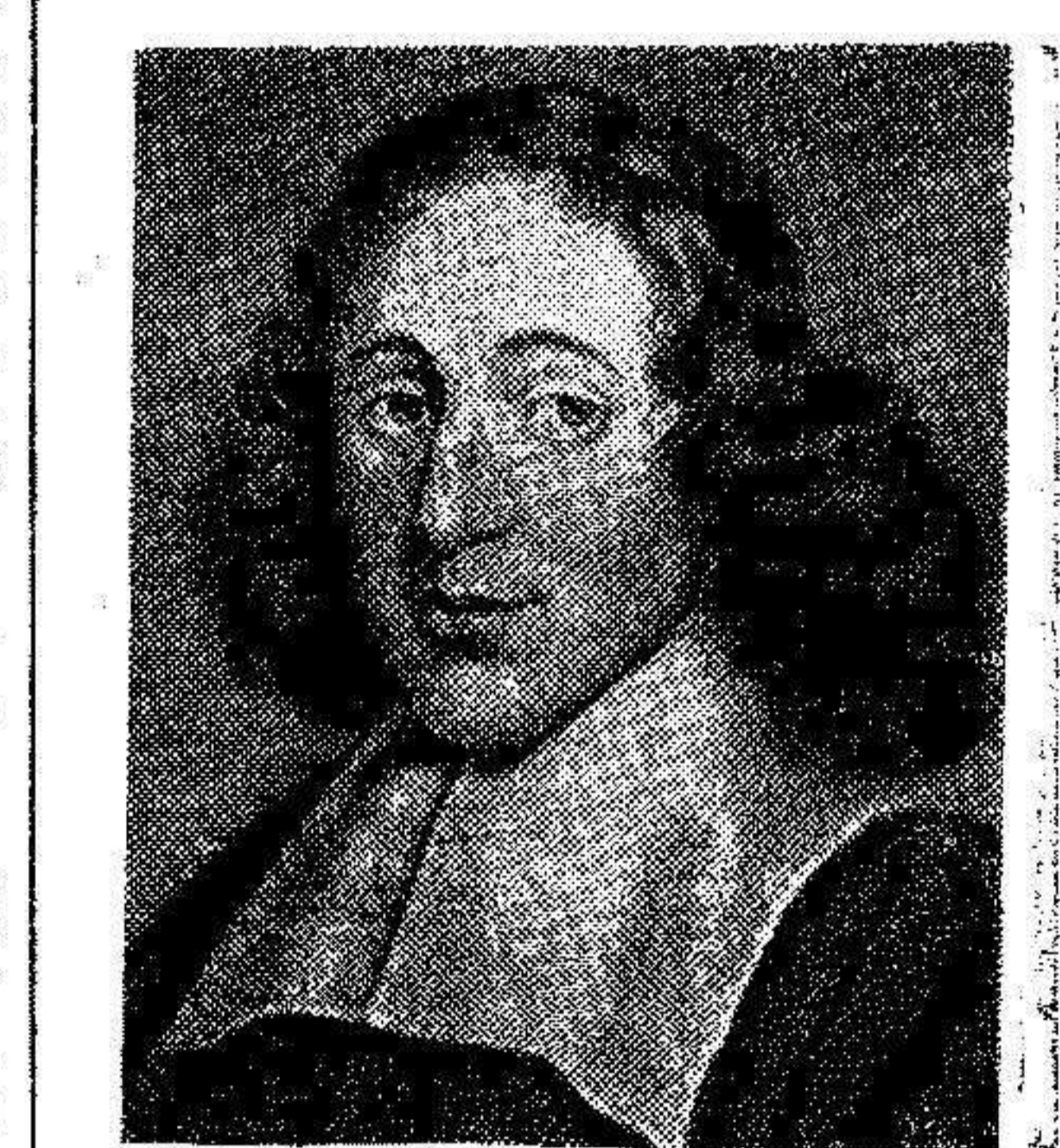
EN NUESTRA FOTOGRAFIA APARECE EL GRAN FILOSOFO DOLANDÉS BARUCH SPINOZA, EN CUYA MEMORIA CON MOTIVO DE CUMPLIRSE EL TERCER CENTENARIO DE SU NACIMIENTO SE HAN CELEBRADO EN AMSTERDAM, DIVERSOS ACTOS CULTURALES.