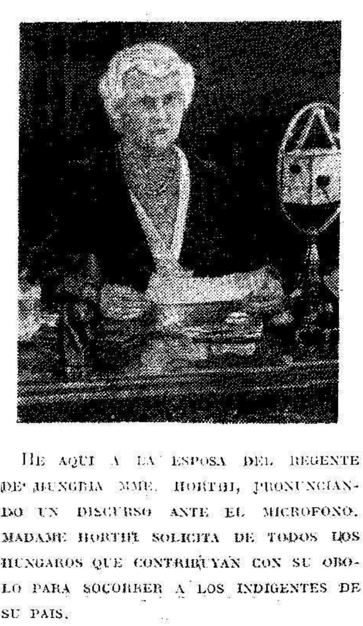
He aquí a la esposa del regente de Hungría MME. HORTHI, pronunciando un discurso ante el micrófono. MADAME HORTHI SOLICITA DE TODOS LOS HUNGAROS QUE CONTRIBUYAN CON SU ORO PARA SOCORRER A LOS INDIGENTES DE SU PAIS.