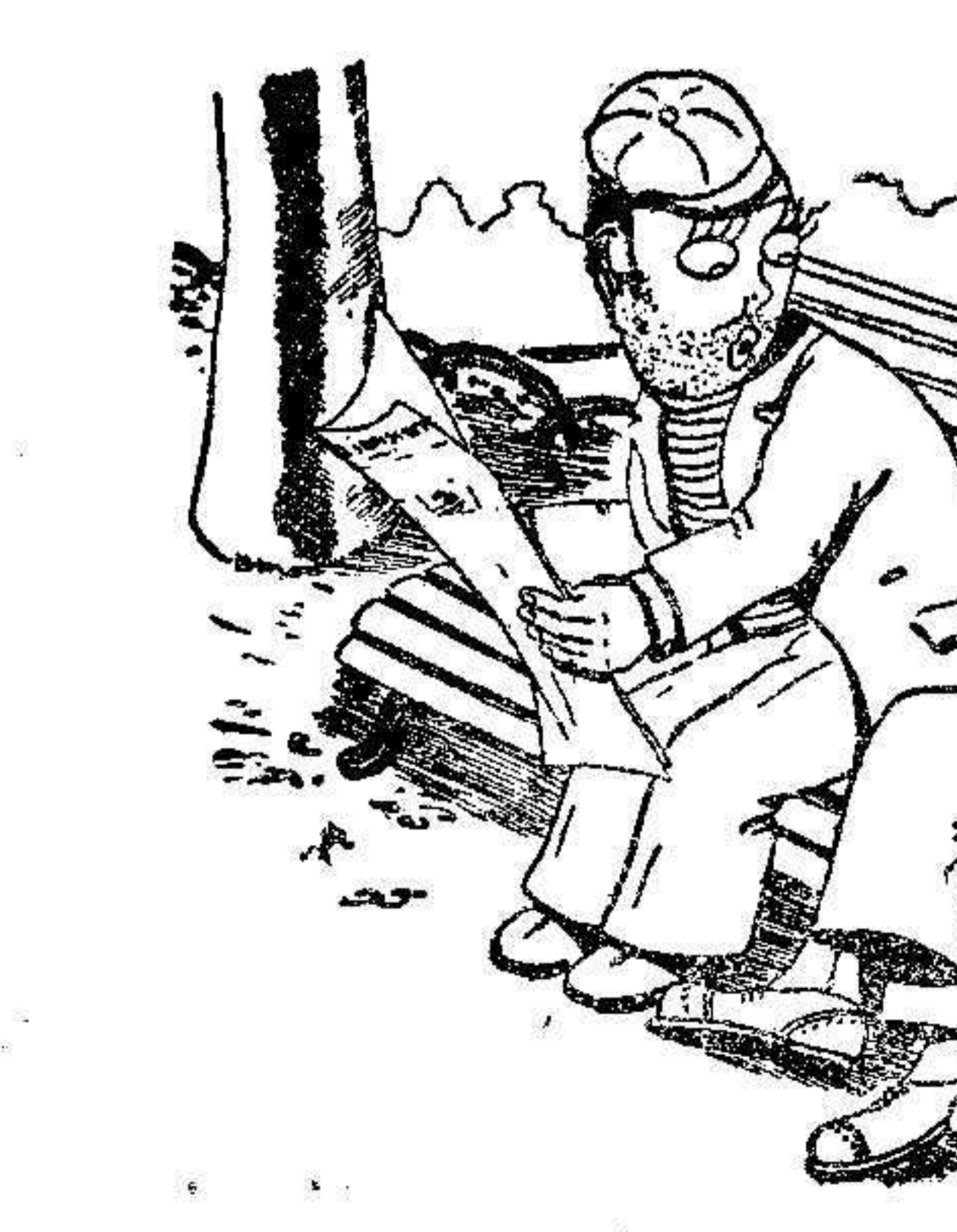
—Tu tipo me ha dicho que va a ir mañana a las carreras de caballos. —¿Es que corre él también?