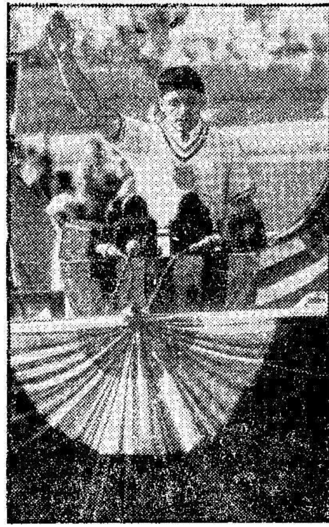
En los juegos olímpicos, todos cuantos amateurs han intervenido, han prestado juramento de ser en efecto verdaderos aficionados. La foto muestra a M. George Calnon, el famoso tirador americano jurando en nombre de todos los amateurs presentes en Los Angeles.