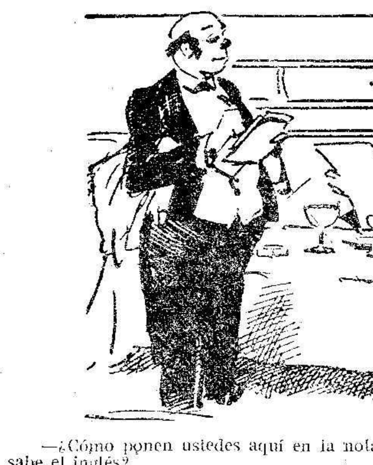
—¿Cómo ponen ustedes aquí en la nota, «Englis spoken», si en la casa nadie sabe el inglés? —Precisamente por eso lo hacemos. Para que venga alguno.