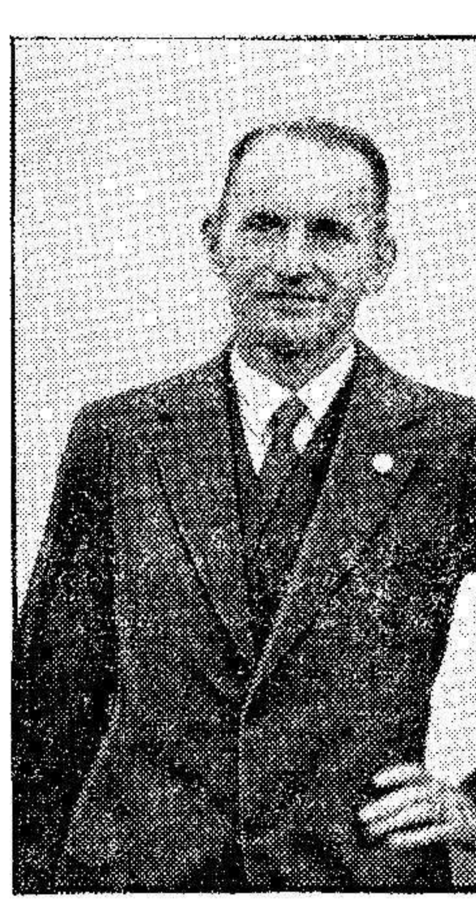
El aviador Wolfgang von Grau, aviador alemán, que después de haber llegado a Greentauda, por Islandia, ha cruzado el Océano Atlántico por tercera vez.