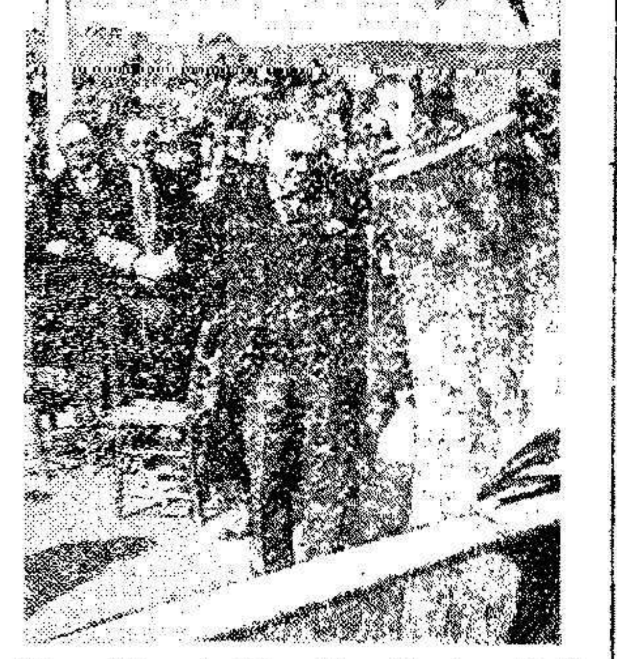
El político inglés, Mr. Stanley Baldwin en el acto inaugural de la plaza conmemorativa inaugurada en un arbol sito en la villa de Saliyárra, en el Sur de Inglaterra, donde antiguamente las miembros del Parlamento Inglés eran elegidas.