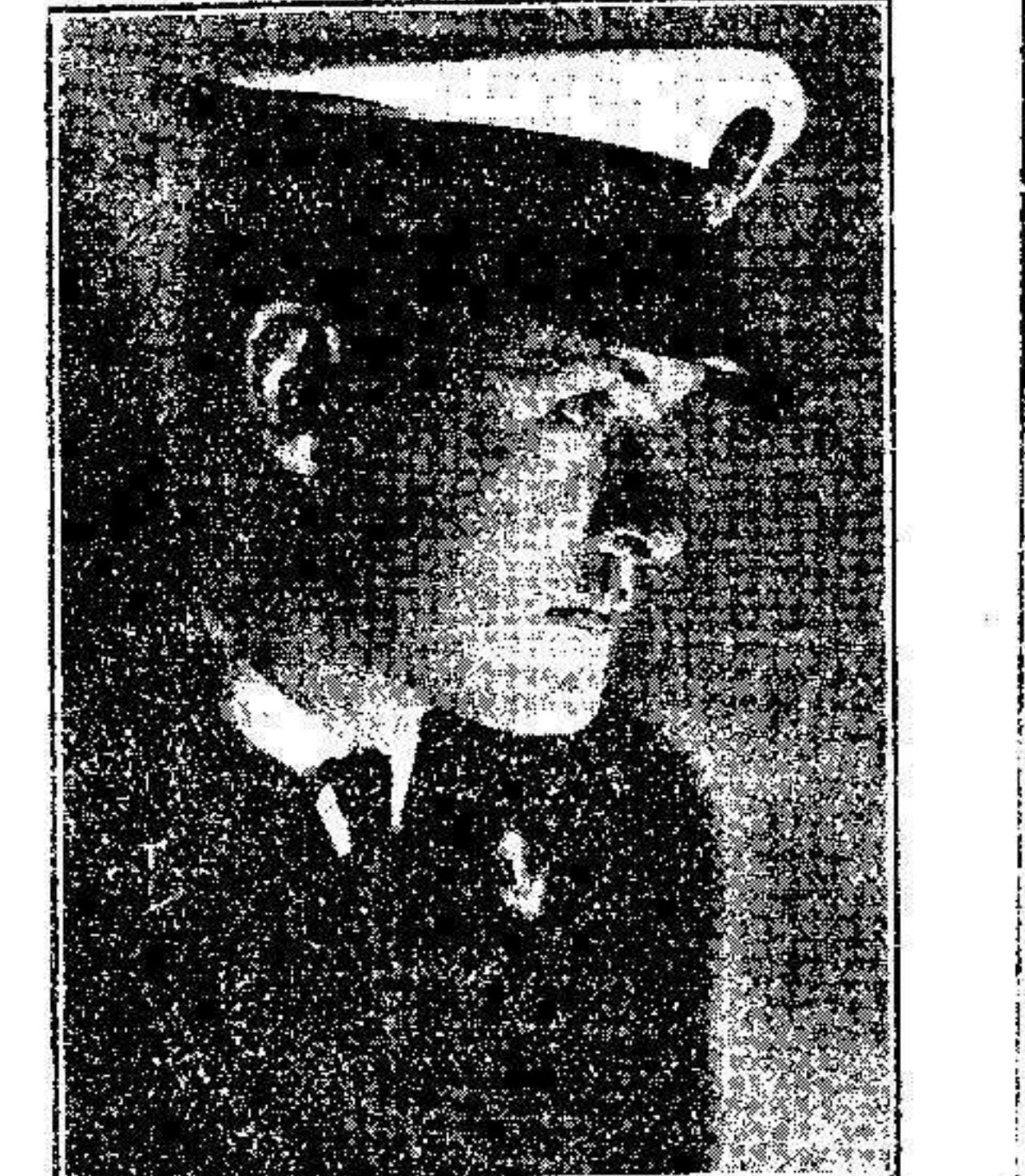
Roberto Montgomery, en la película 'Simplicísimos', nueva cinta de la Metro-Gowin-Mayer.