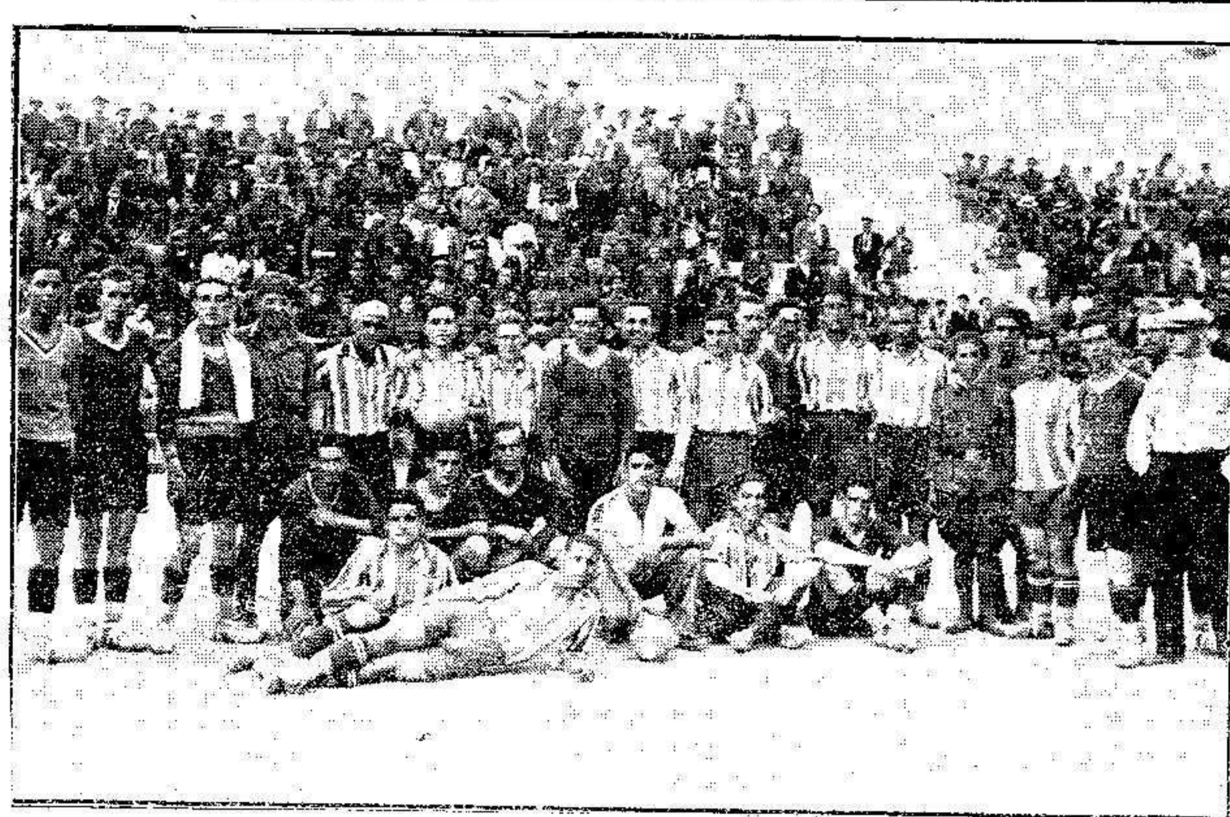
Los equipos Santa Bárbara, de Villa Sanjurjo, e Hipica, que en el encuentro celebrado el domingo en el campo de esta última sociedad resultaron empatados.

Tercer artículo de Mayo 1931. Dionisio PEREZ (Prohibida la reproducción)