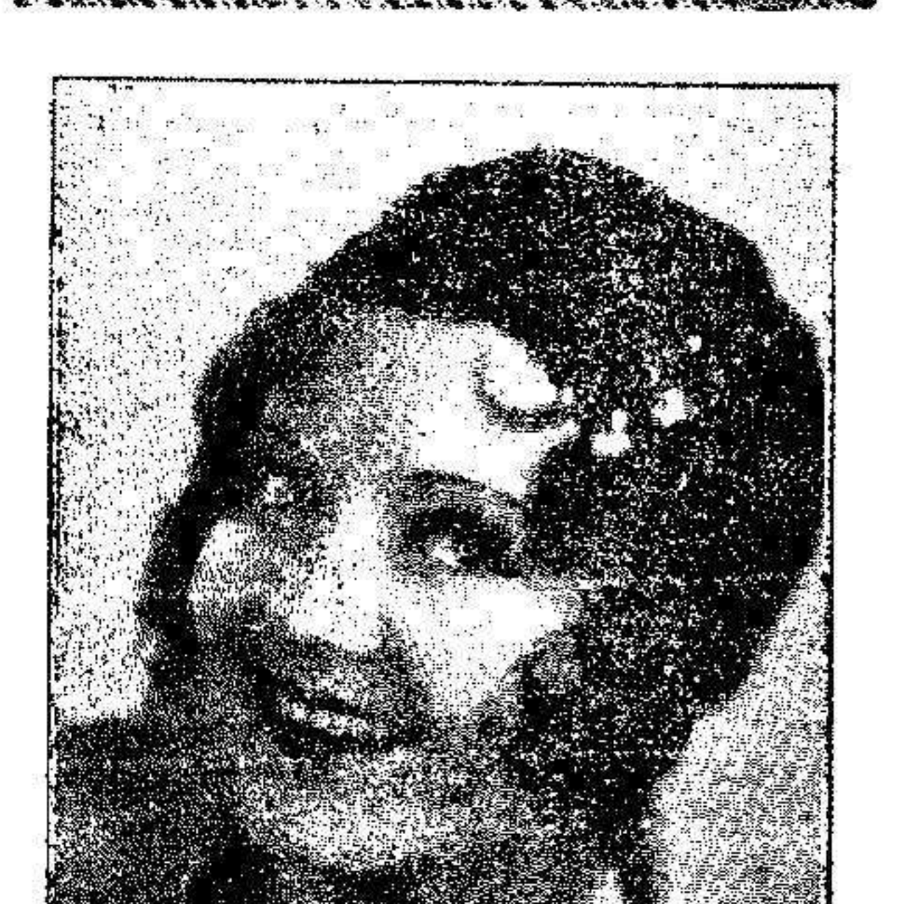
La deliciosa estrella Nancy Carroll