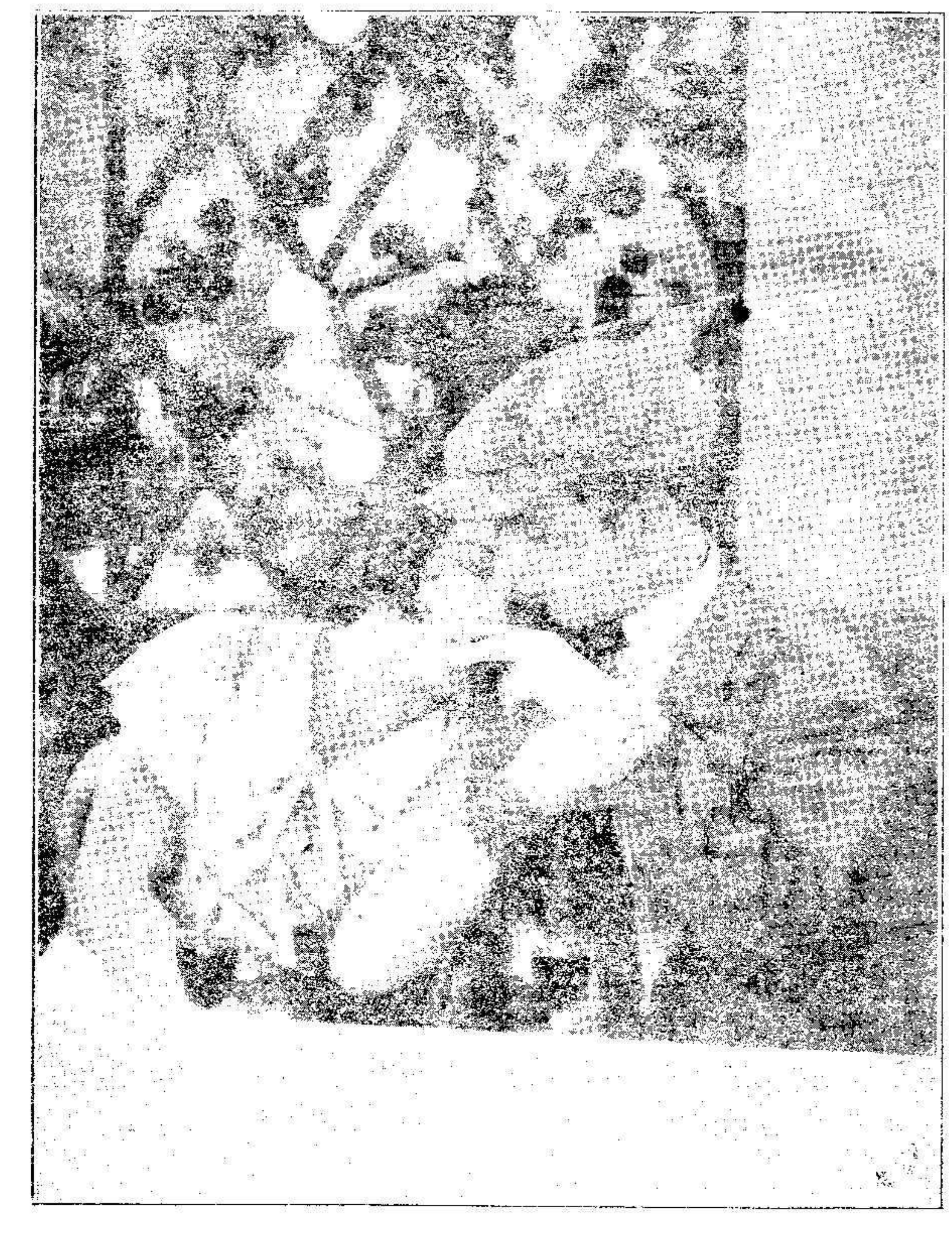
Una escena de 'Sous les toits de Paris', película de René Clair, que, según la crítica extranjera, marca un avance notable en el cine sonoro