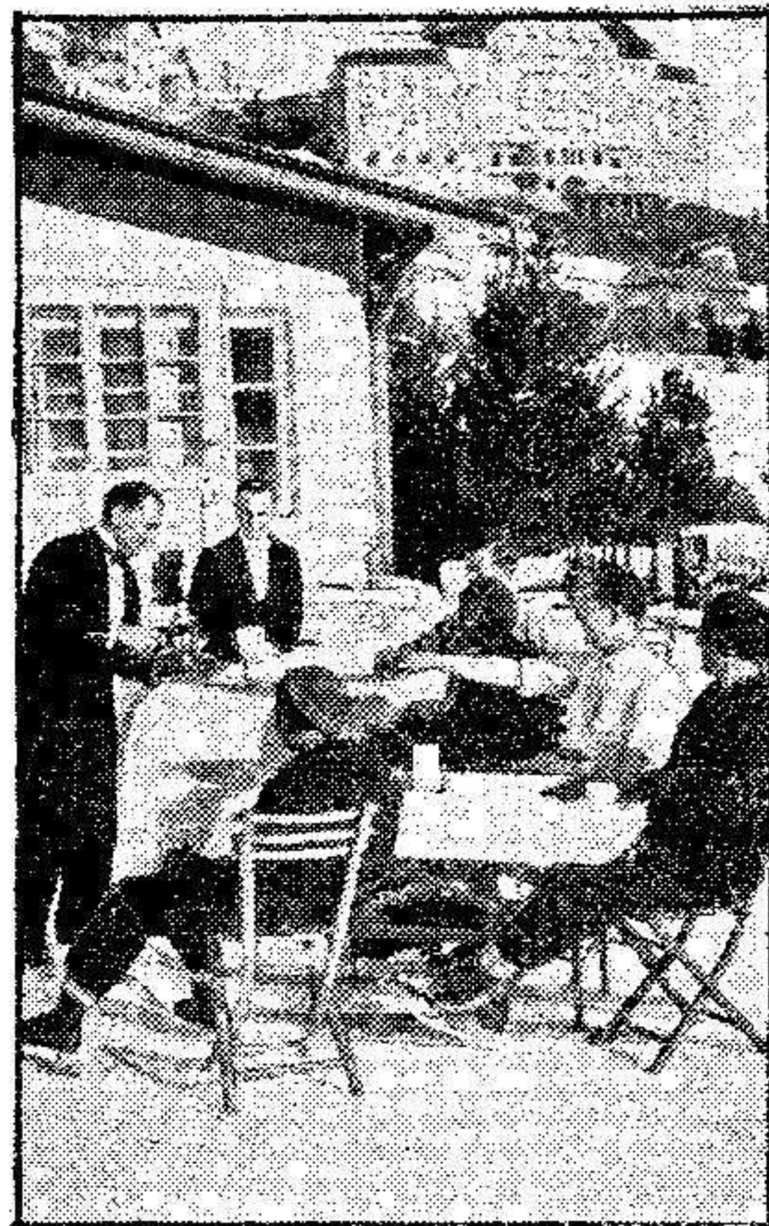
La mayoría de los hoteles de Suiza, han instalado en los lugares visitados por los patinadores, bares a la americana, donde los turistas son servidos por mozos calzados con patines.