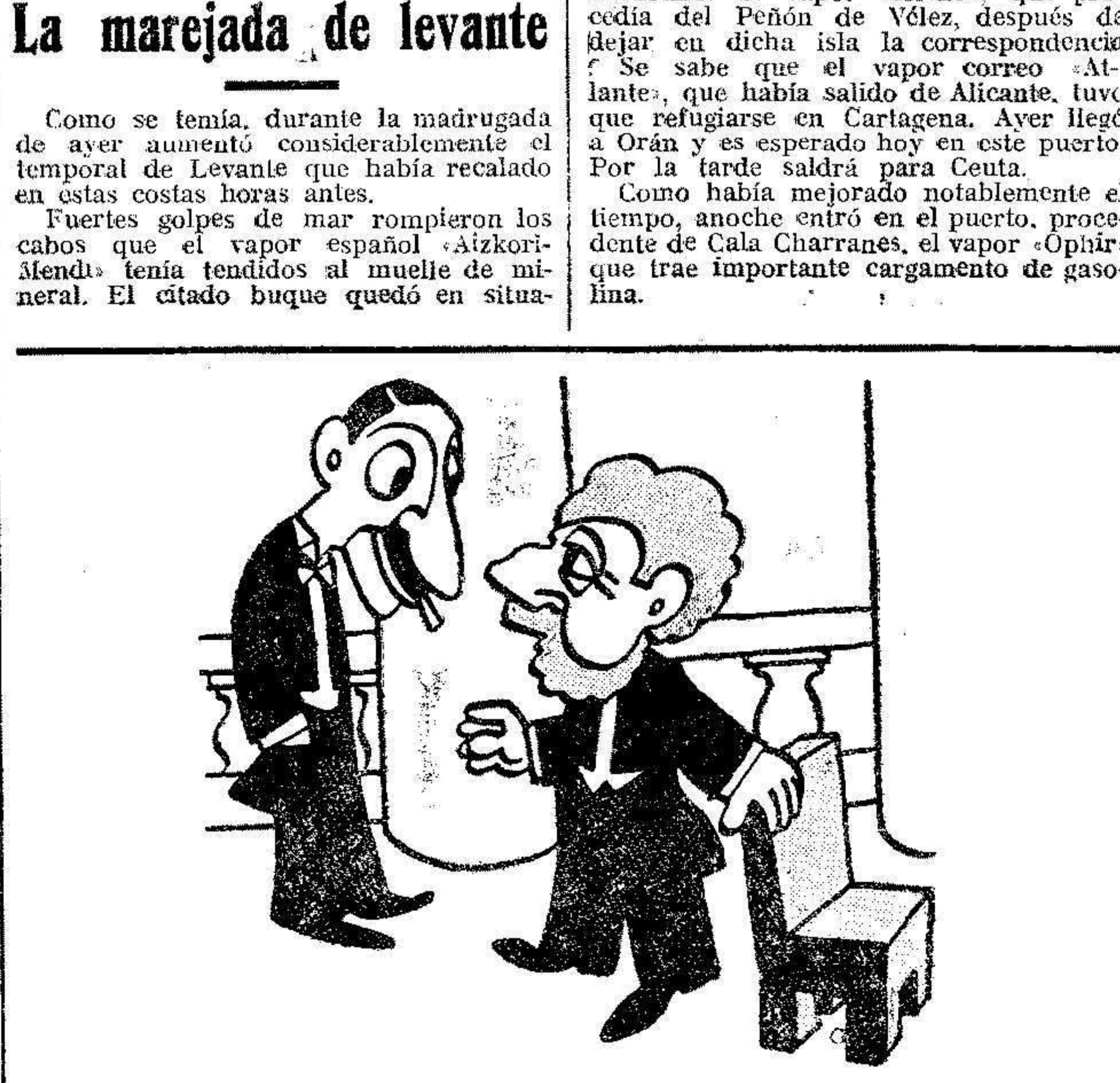
LA DESPEDIDA CUMPLIDA