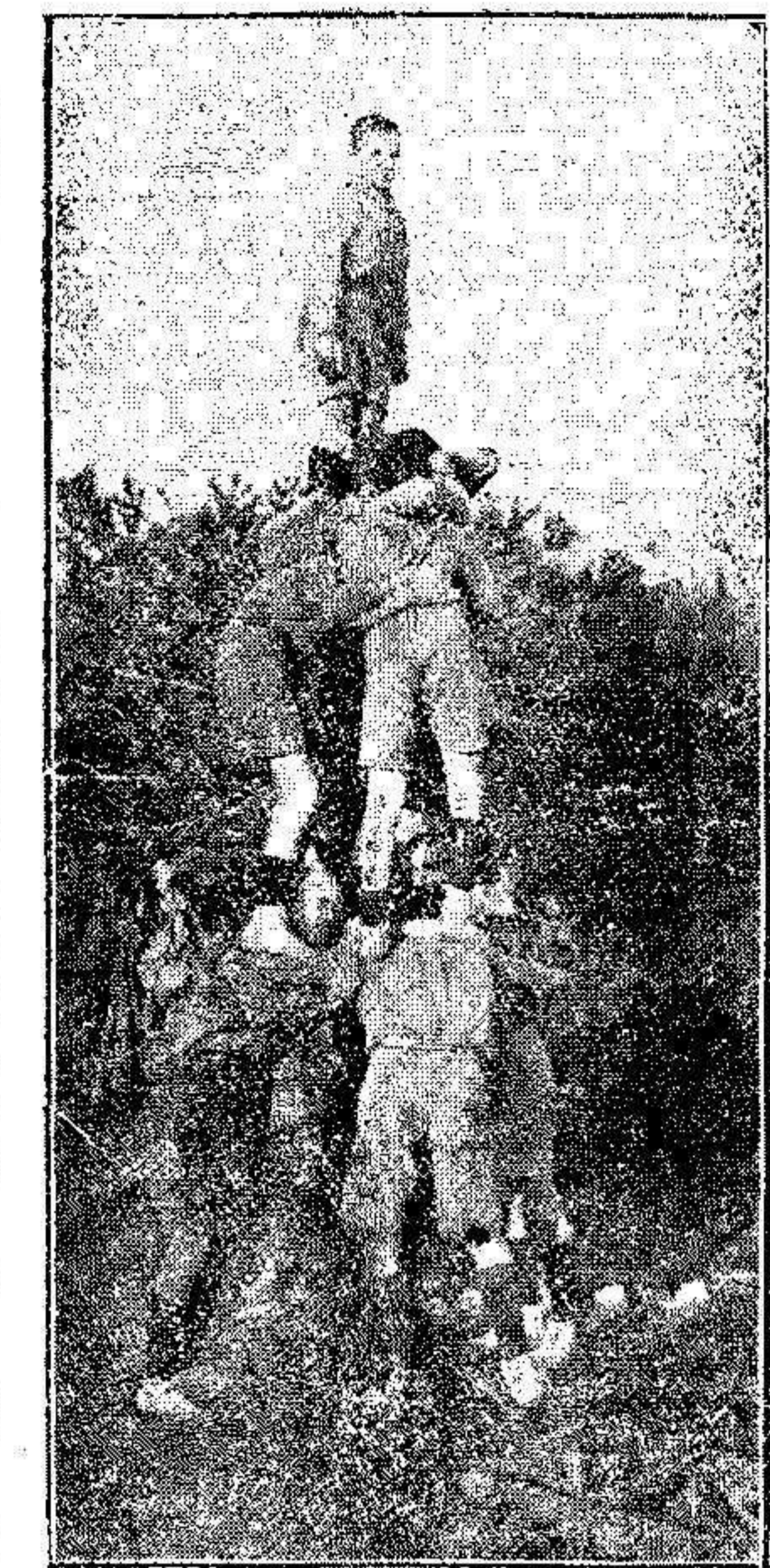
Un grupo de niños exploradores, efectuando la atalaya.