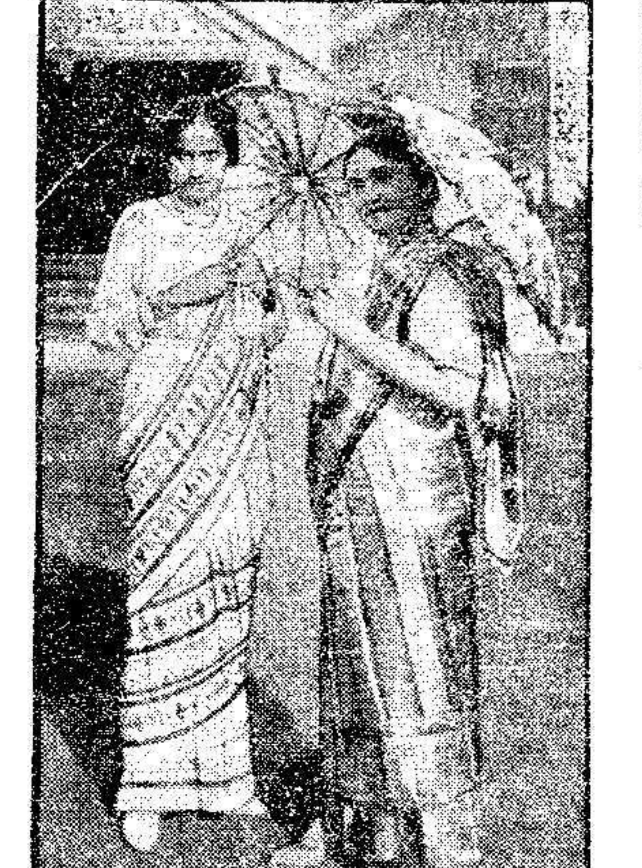
La fotografía muestra a dos bellezas indias de la alta sociedad de Calcuta, el último grito de la moda. Los trajes se componen de una larga pieza de seda y que arrollan alrededor del cuerpo. Obsérvese el curioso lector la longitud de los vestidos y las sombrillas que completan la composición de aquéllas.

generales de ceremoniales, honores y preferencias, el uso de la toga, el traje doctoral, los colores del fondo de los vestidos, etcétera, etc. Los rectores de las universidades, como Corporación, tendrán el tratamiento de Magnífico Señor, que tendrá equivalencia completa con el tratamiento de Excelencia.