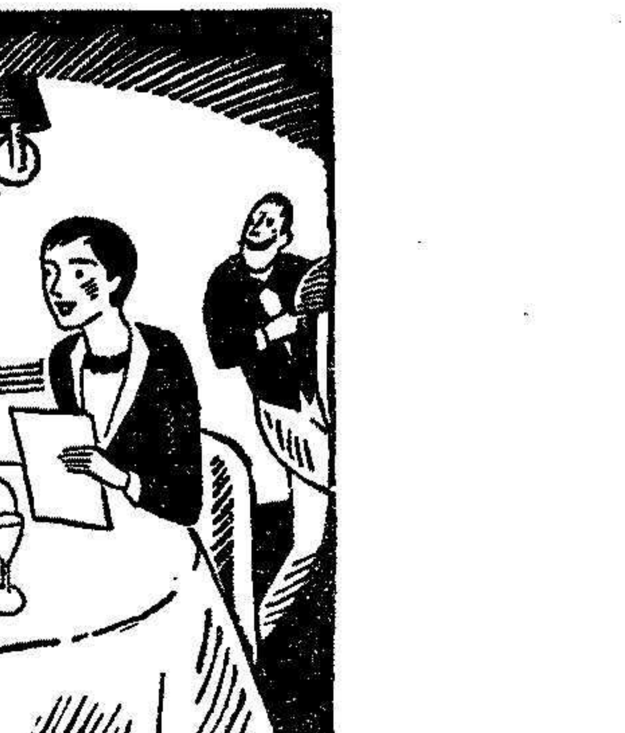
LAS VIEJAS GENERACIONES

Se concede un voto de confianza al PRESIDENTE para que determine lo que ha de abomarse a los guardias municipales por el cobro de multas.