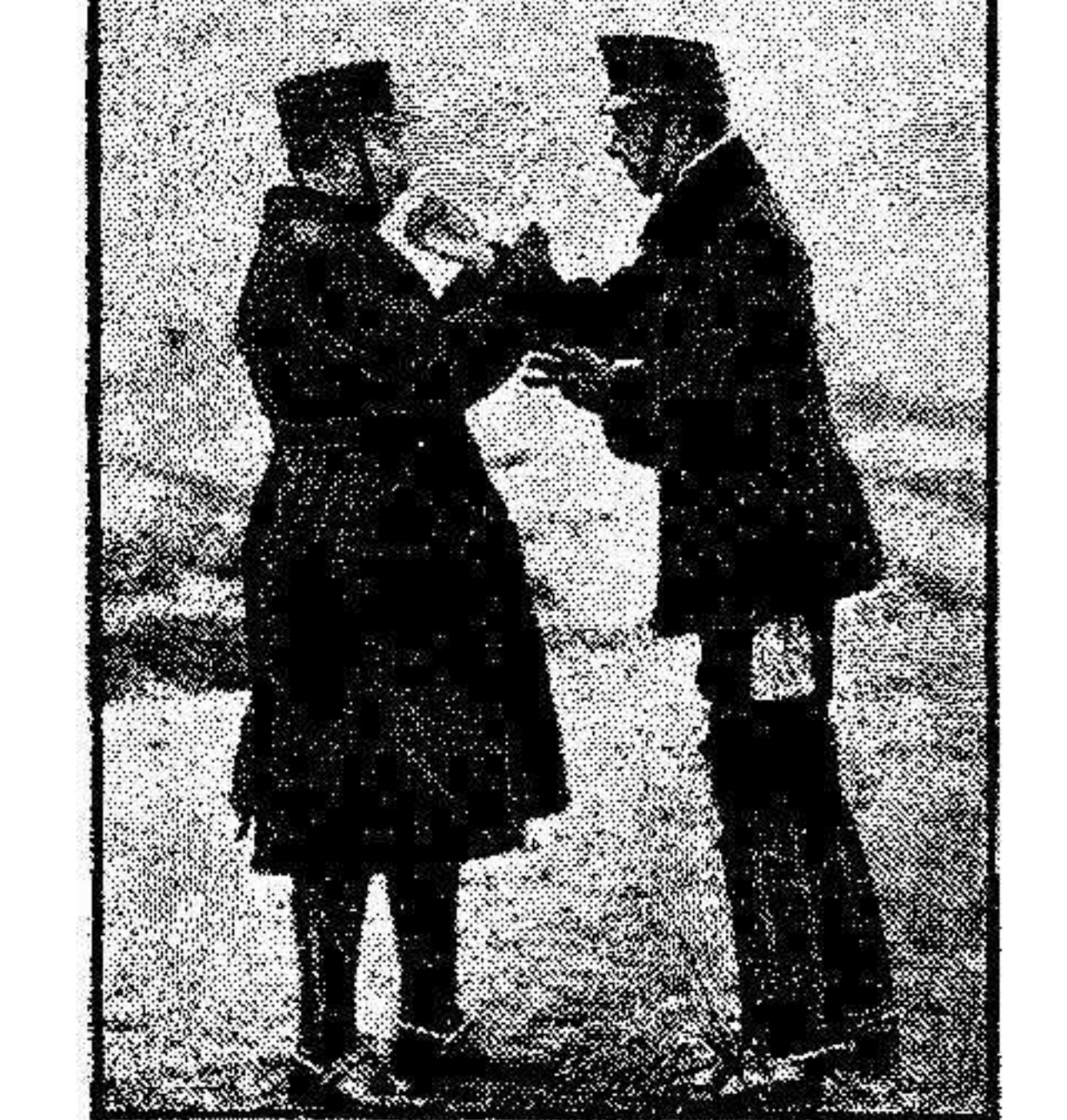
Durante las últimas maniobras militares celebradas por las fuerzas de la primera región, S. M. el Rey asistió a ellas para presenciar diversos ejercicios de conjunto. Nuestra fotografía muestra al Monarca, durante un descanso, en los supuestos tácticos, ofreciendo lumbre, con su cigarrillo, al general don Dámaso Berenguer.