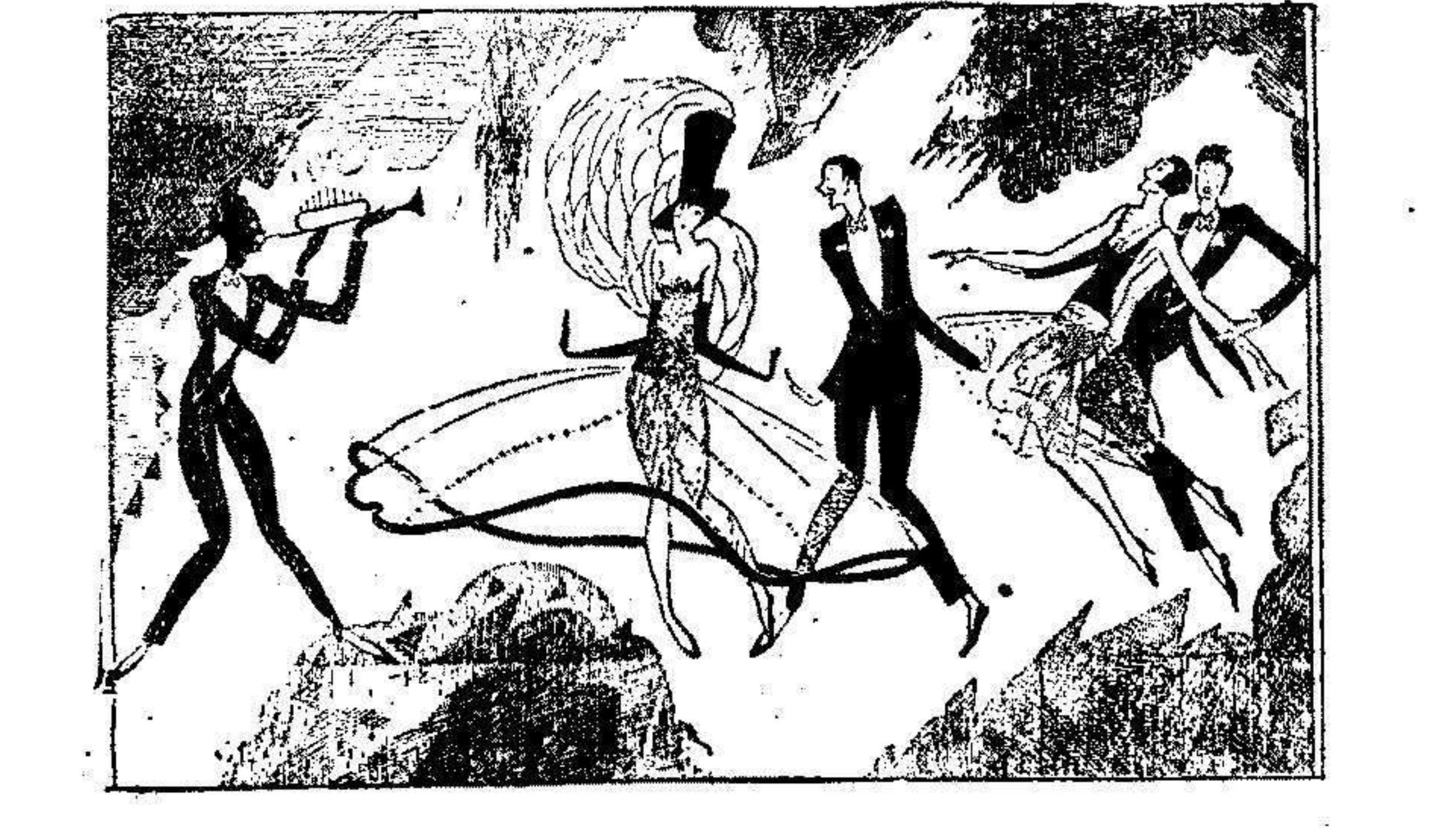
EL DEL JUICIO FINAL —Pero chico, ¡qué clase de baile es este tan horrible! —Del juicio final.