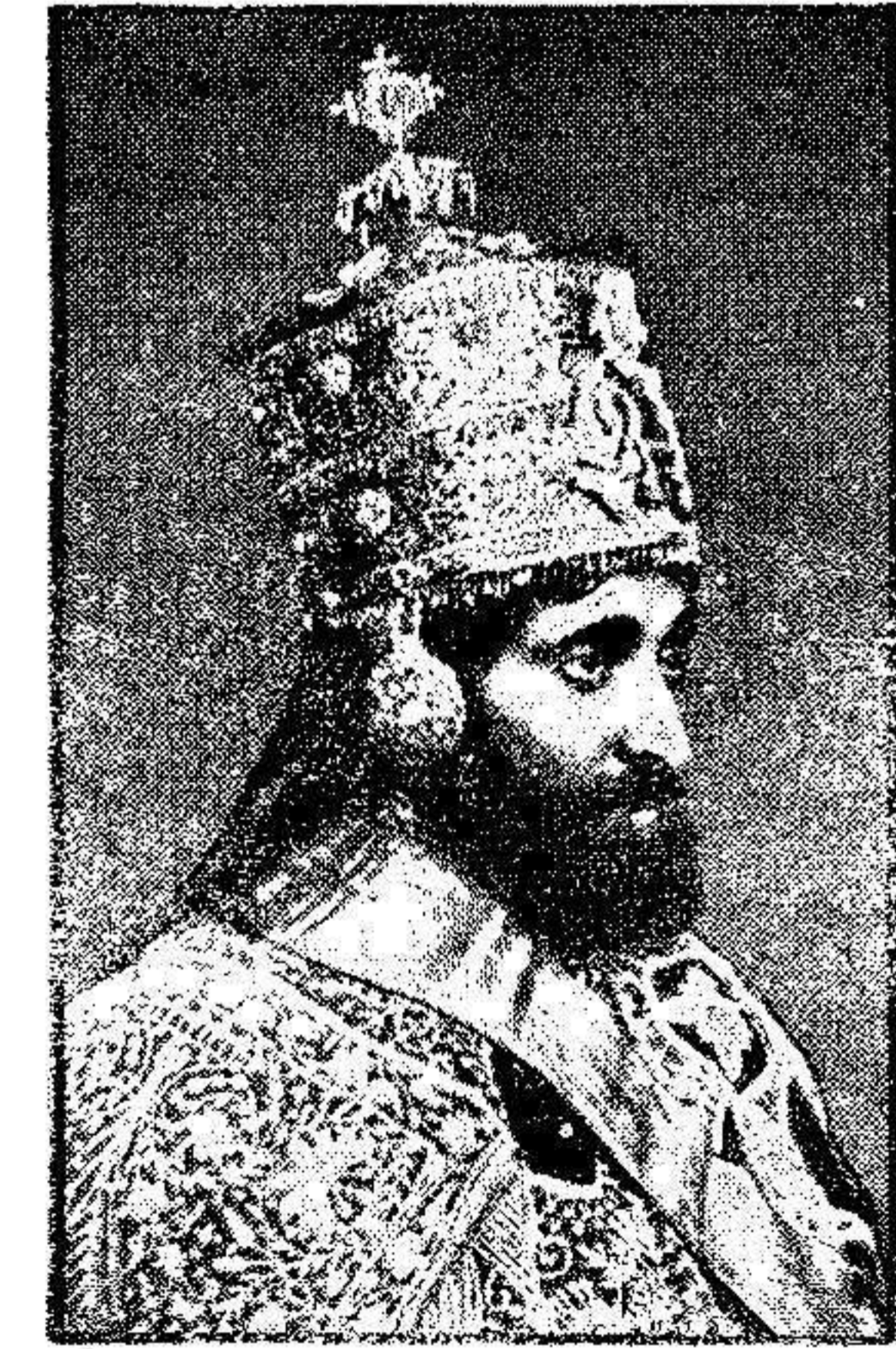
El Soberano de Abisina, Ras Tafari, cuya coronación como Emperador de dicho país, se celebrará en el próximo mes de Noviembre, vistiendo las magníficas galas reales de entre las que se destaca la original corona, de incalculable valor.