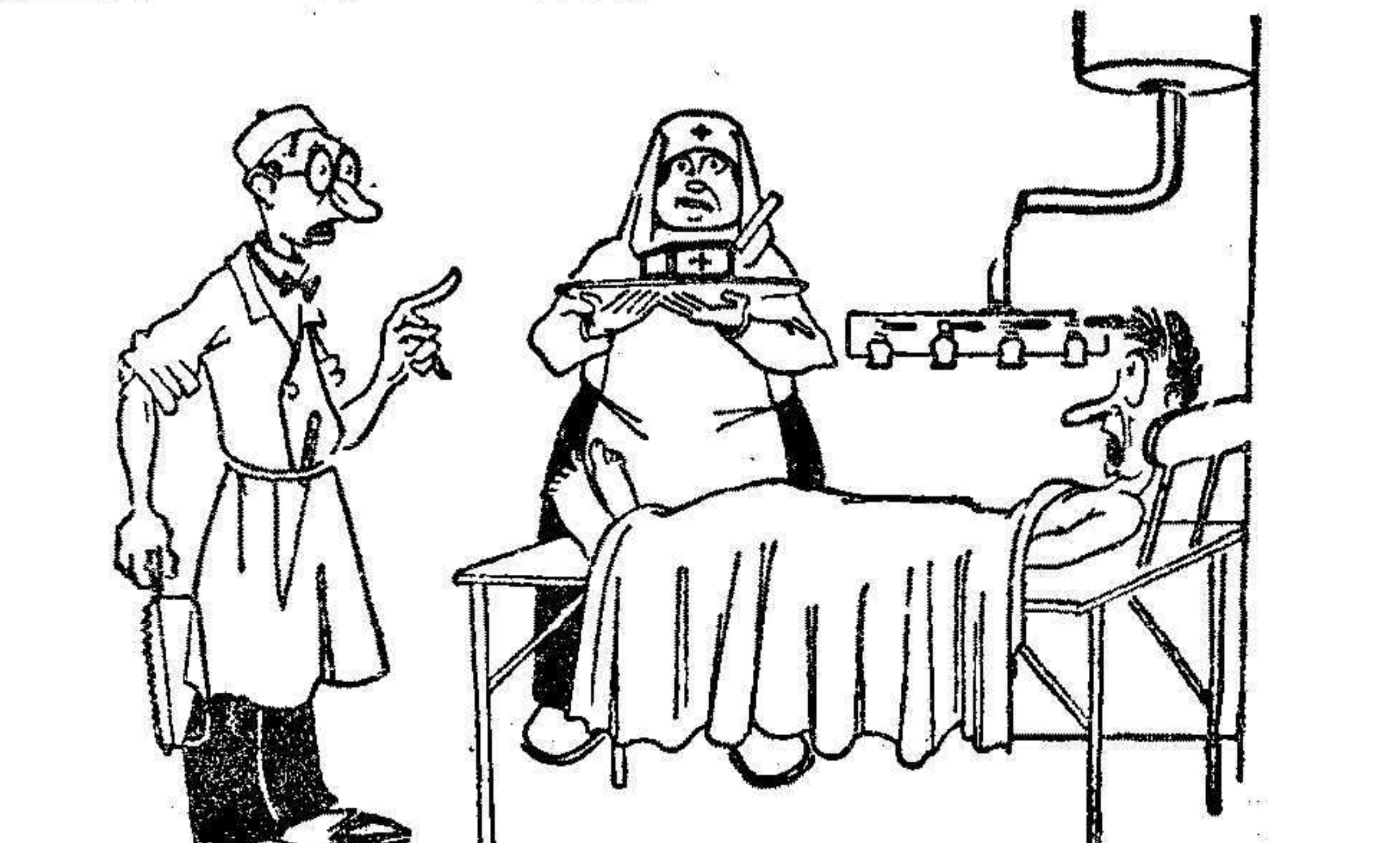
UNA REBAJA EN LA OPERACION

Los viajeros recorrieron detenidamente la ciudad, regresando a la vecina plaza, al caer la tarde.