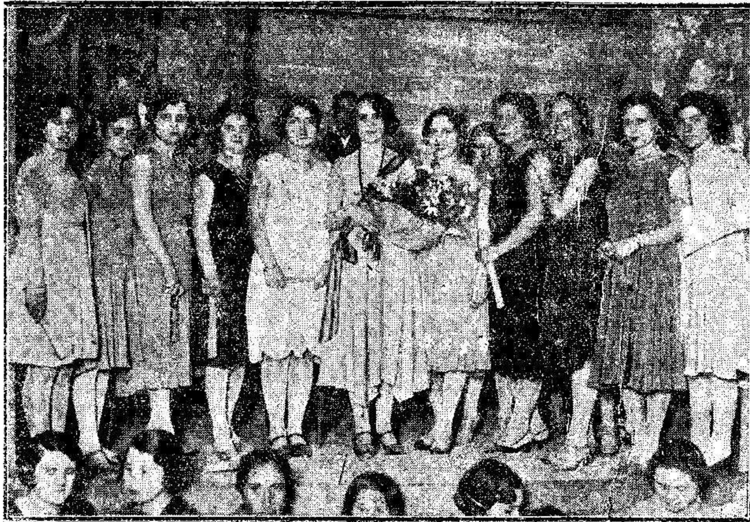
CONCURSO DE BELLEZA EN EL CLUB MELILLA

Día 23.—Tirada de pichón. Concurso de escarapales. Conciertos en la plaza de la Constitución y calles de Granada y de Compañía. Fiesta roja en el Parque de la Merced.