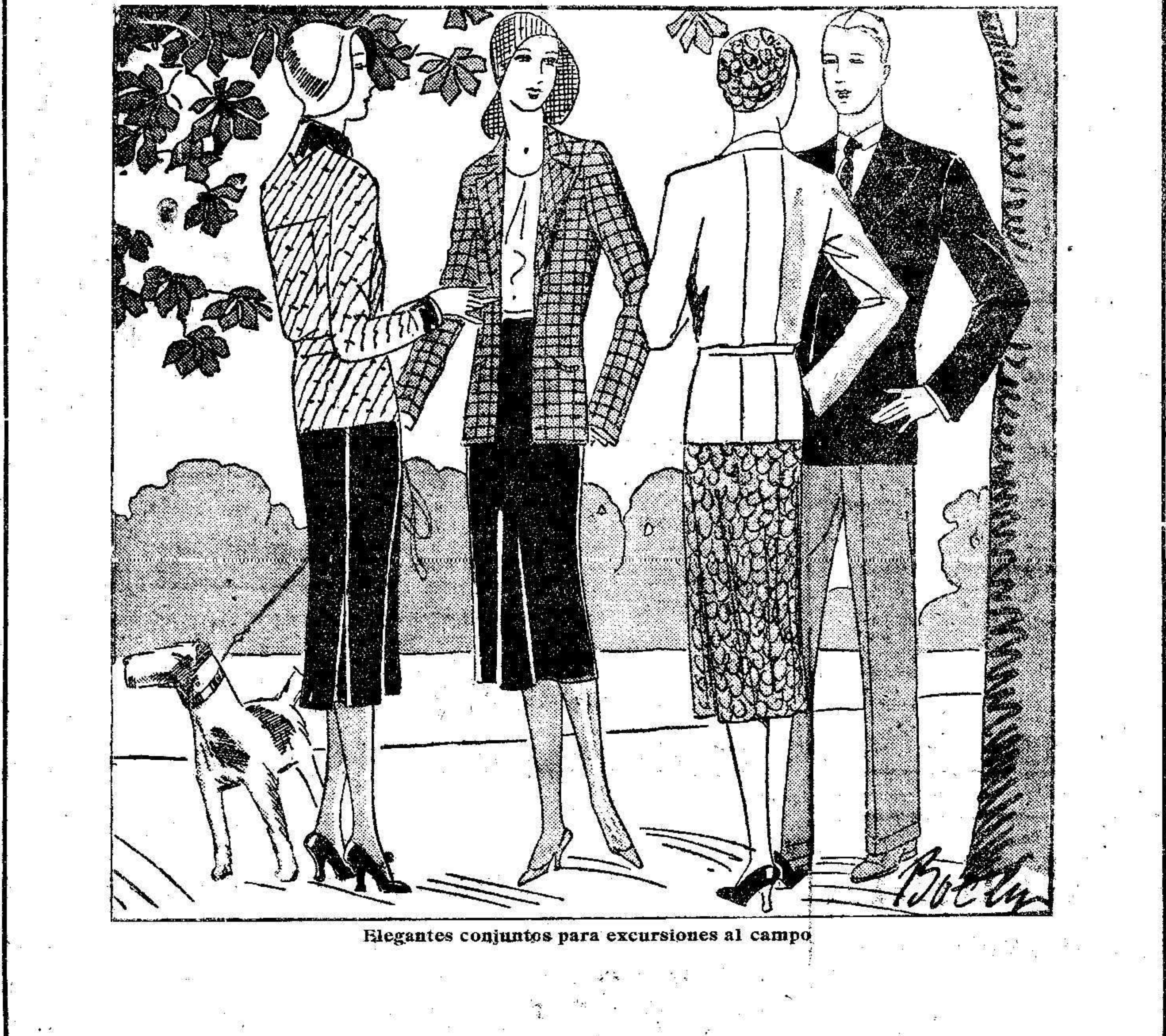
Elegantes conjuntos para excursiones al campo