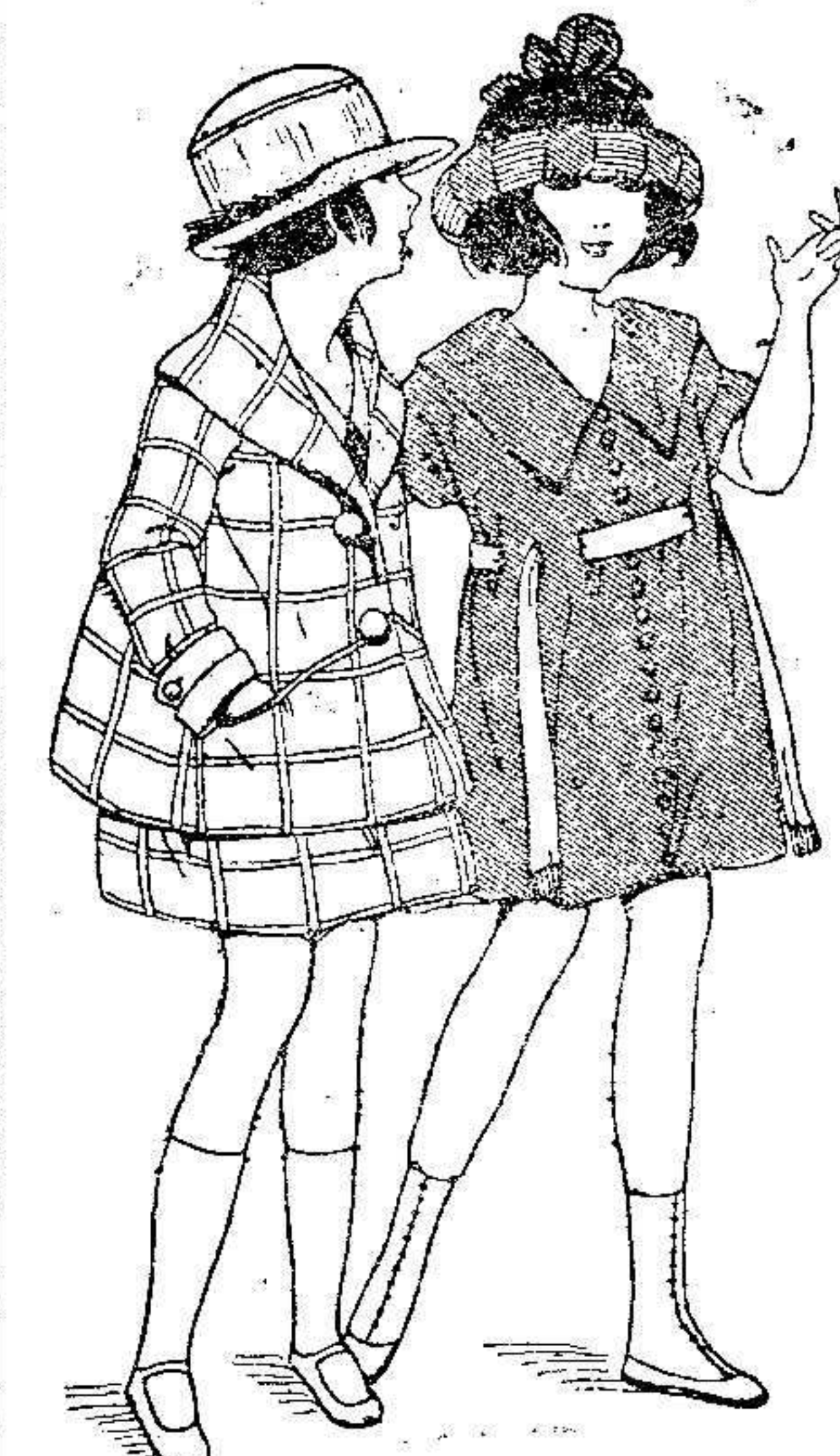
adornos brillantes y el atender a este capricho de sus impresionables sentidos es causa a veces de que se los provea de vestiduras, extravagantes de colorido.