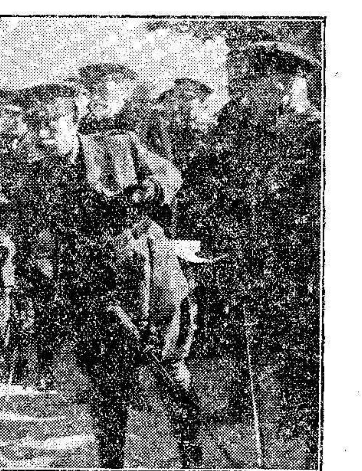
MELLILLA.—El Comandante General señor Castro Girona, estrechando la mano de los soldados licenciados durante la fiesta de la «Despedida del Soldado», celebrada en la Plaza de España.

terminado dando vivas a España, al Rey y al Ejército, que fueron contestados con gran entusiasmo.