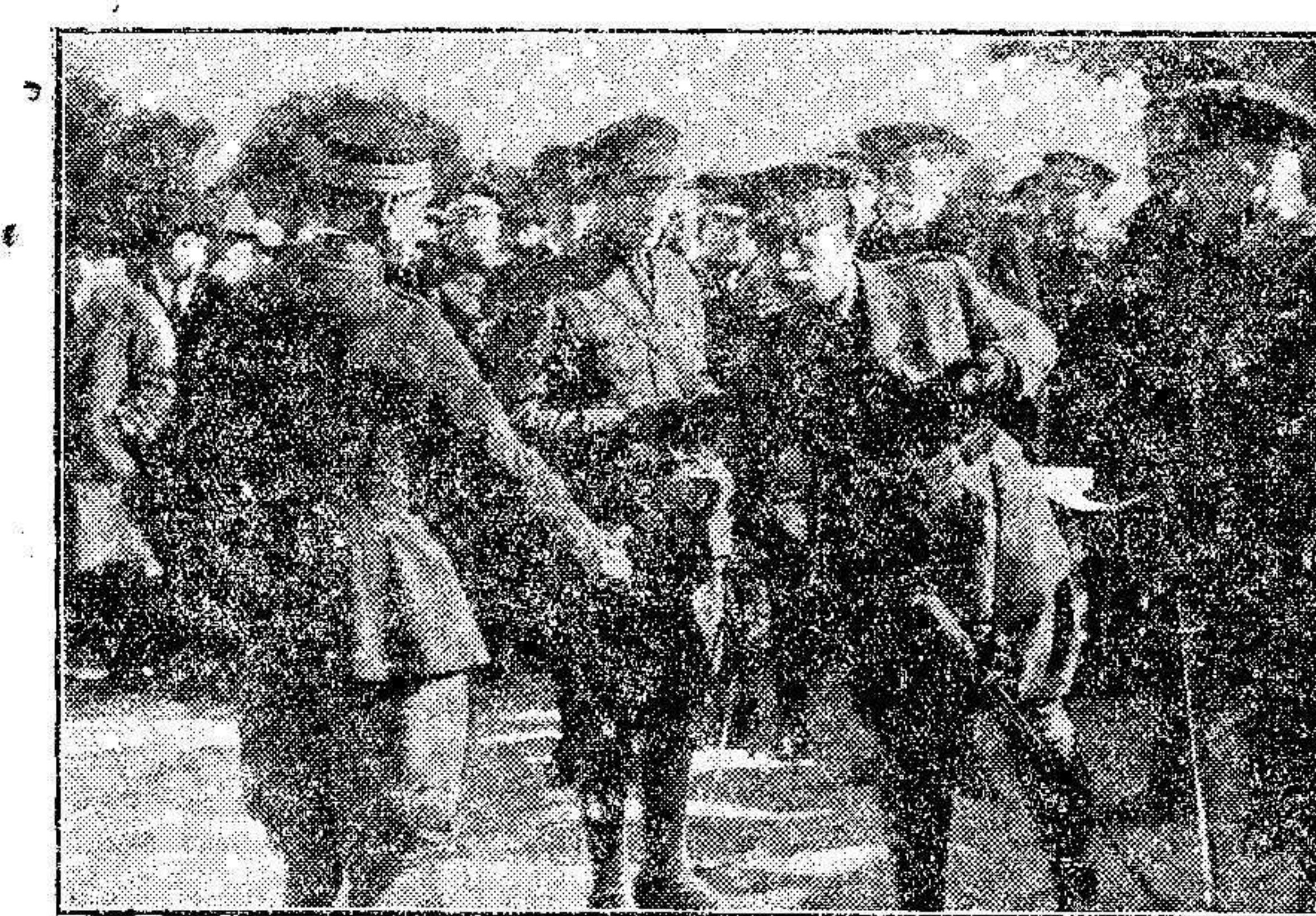
MELLILLA.—El Comandante General señor Castro Girona, estrechando la mano de los soldados licenciados durante la fiesta de la «Despedida del Soldado», celebrada en la Plaza de España.