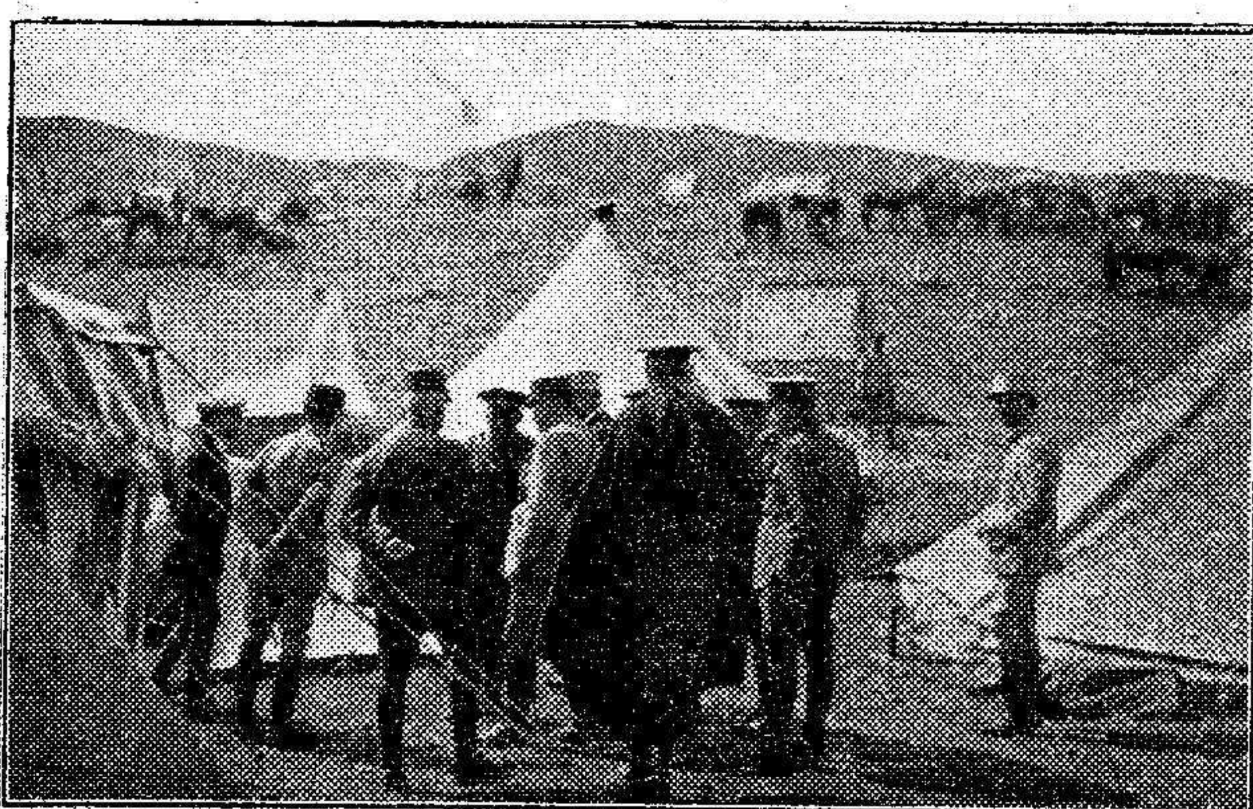
POSICIÓN FRANCESA DE HASI GUENZA Entrevista de los generales Sanjurjo y Boichut