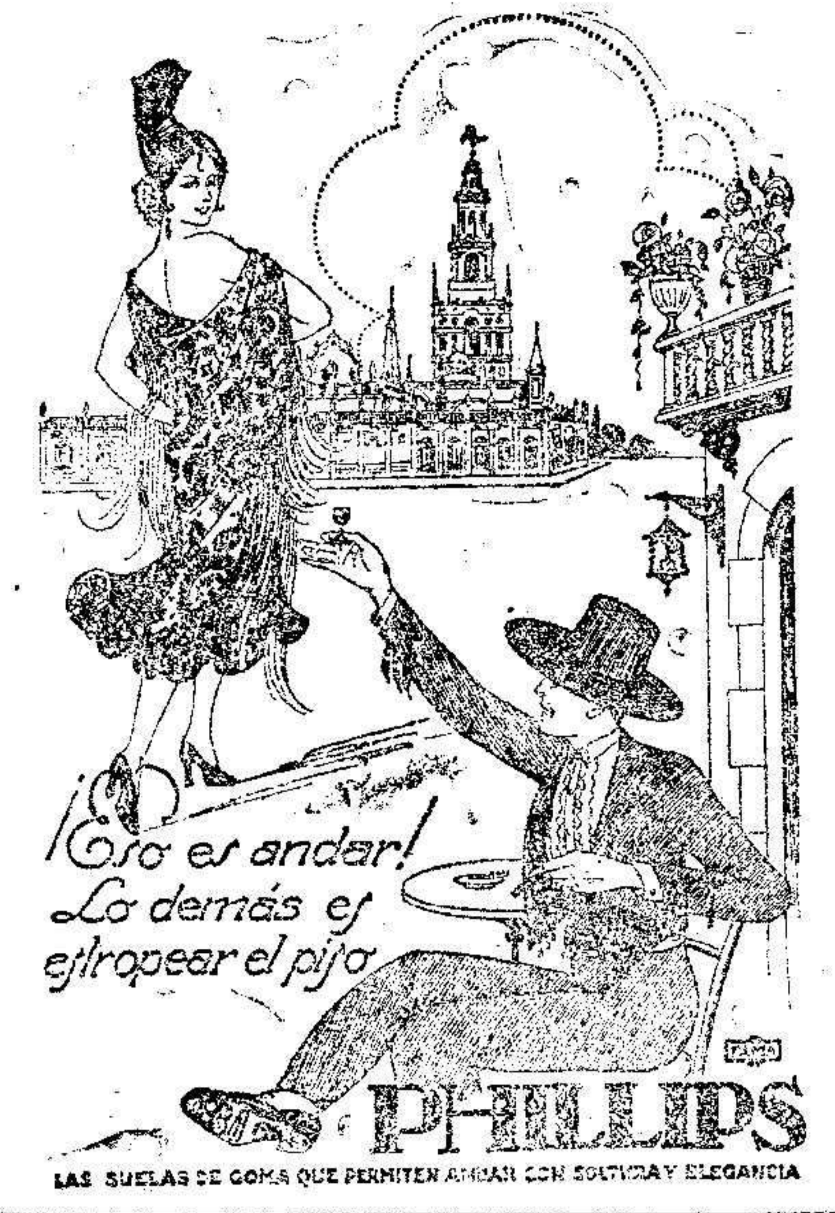
LAS SUELAS DE GOMA QUE PERMITEN ANDAR CON SENCILLA Y ELEGANCIA

Hasta las cuatro de la madrugada se admiten esuelas de defunción en la Administración de este periódico.