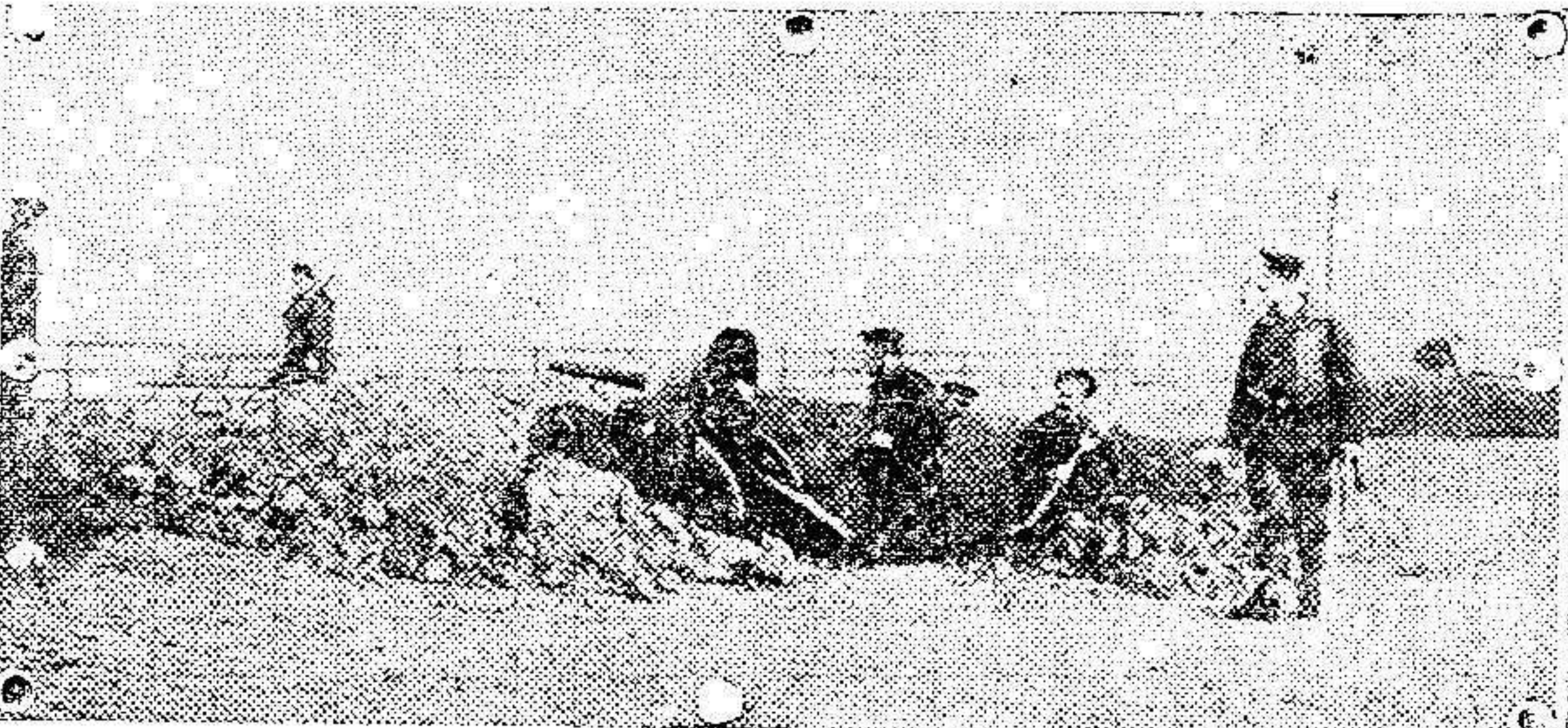
Los marinos alemanes emplazando baterías para la defensa de la costa de Ostende.

Los novios están recibiendo valiosos regalos.