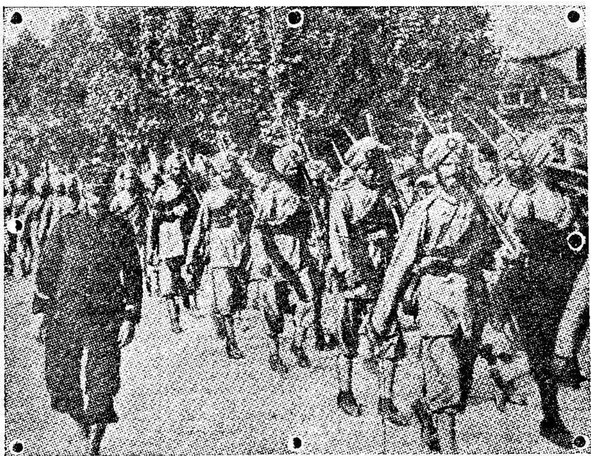
Tropas indias desembarcadas en Francia con dirección á los puntos de combate.

Francos concertados. - No se devuelven los originales. N.º 9.080