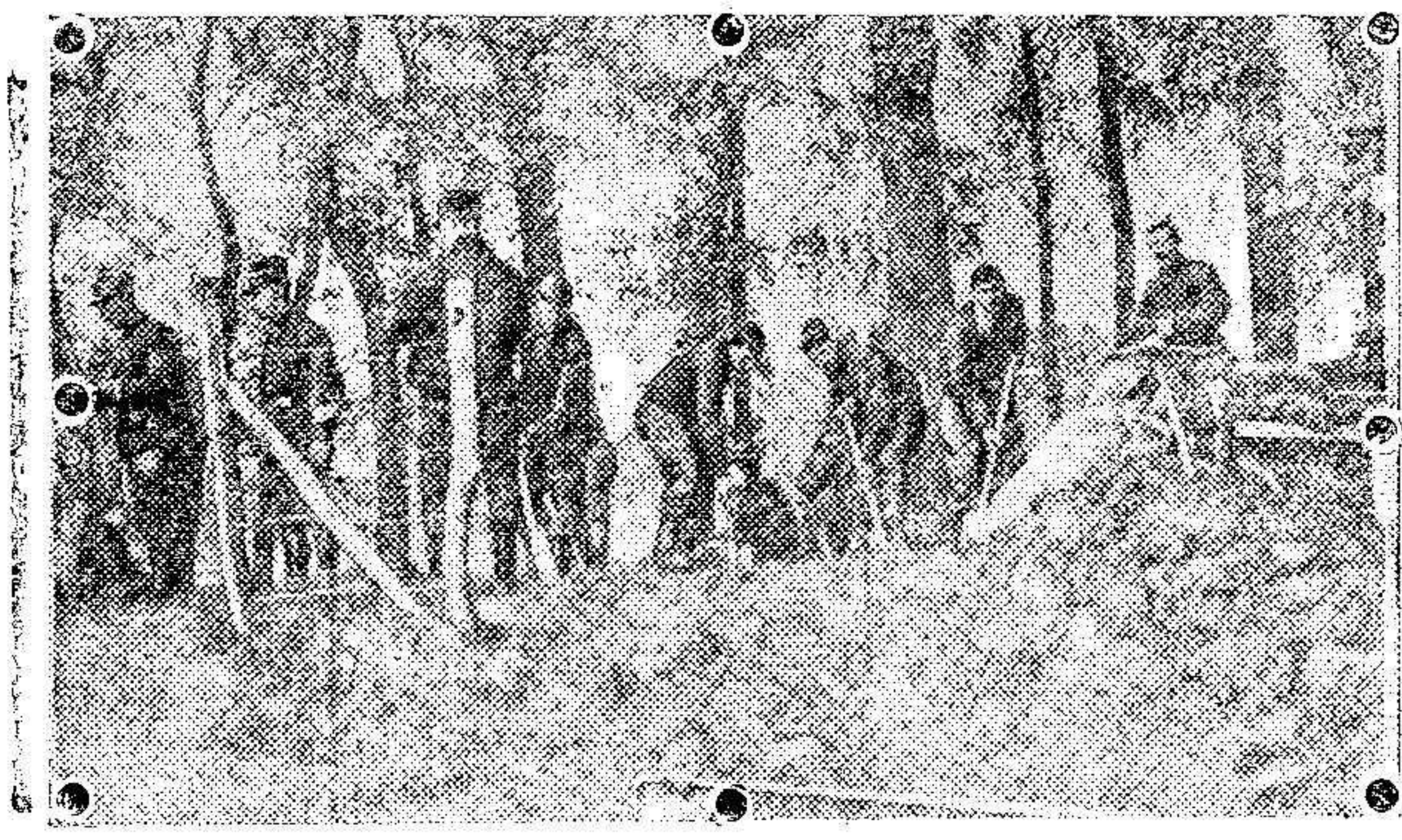
Grupo de soldados belgas trabajando en las defensas exteriores de Amberes.

Estos arrojaron algunas bombas sobre la estación radiotelegráfica de un cuartel siendo tiroteados vivamente. Uno de los aeroplanos resultó con averías a causa de un balazo, pero logró regresar al campamento.