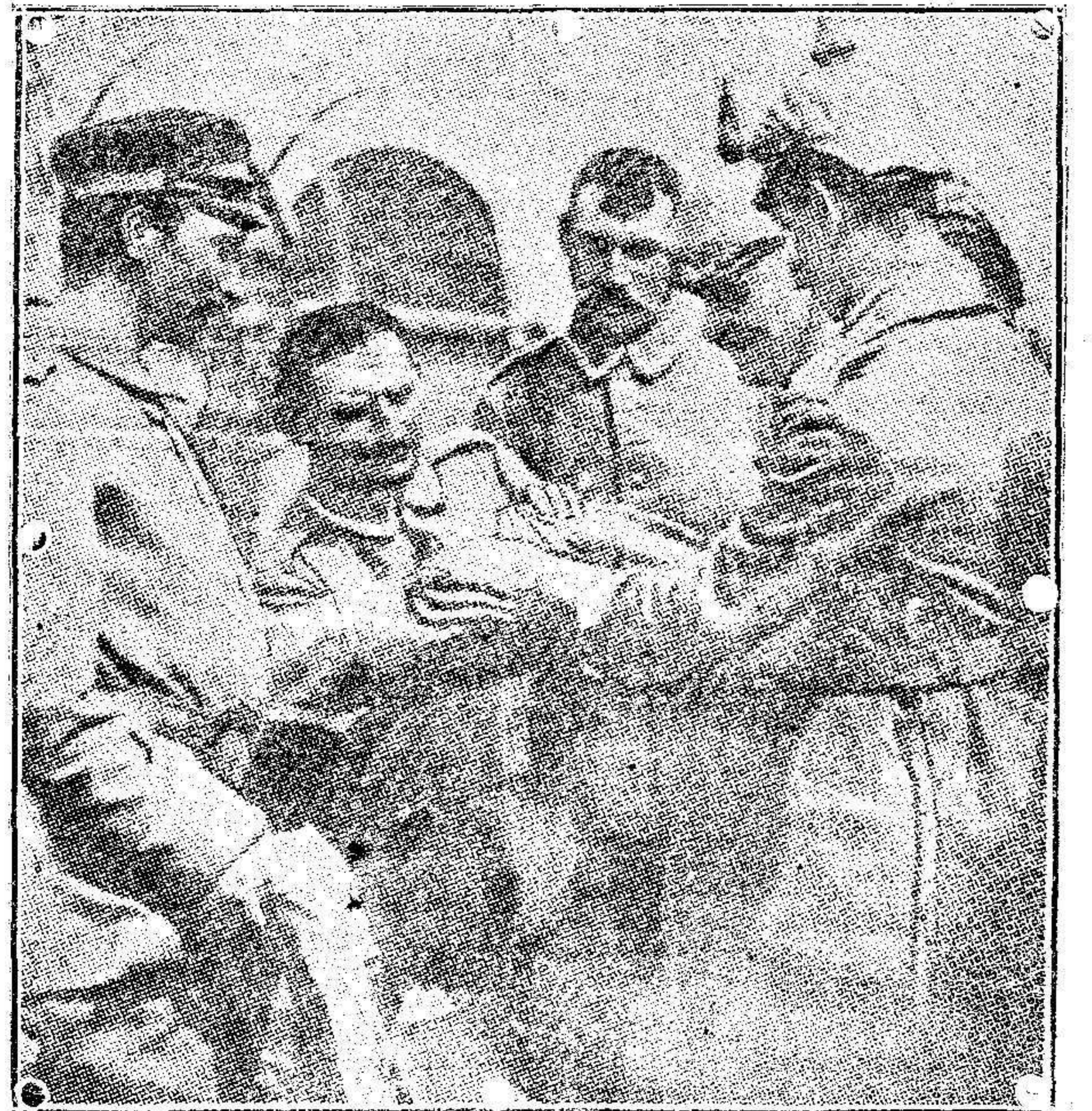
El servicio de pan y jamón á los soldados alemanes durante su marcha hacia Bruselas.

En mi discurso resumen, he pasado revista á los principales sucesos relacionados con la política exterior fijándome de un modo especial en el curso de las operaciones de la guerra europea.