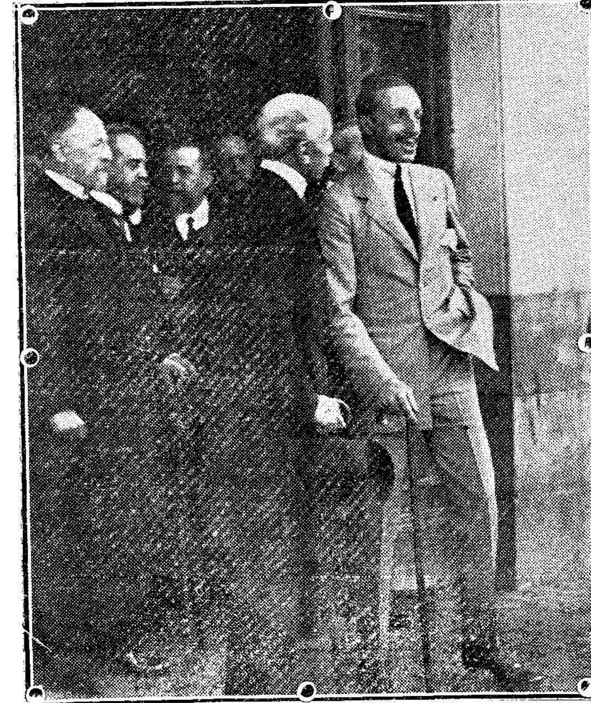
Su Majestad el Rey don Alfonso, acompañado del presidente del Consejo y de los ministros en la estación del Norte