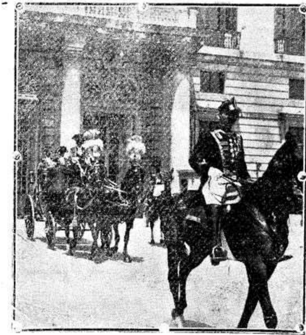
La Princesa Esperanza, bautizada en el regio Alcázar, y sus padrinos, al dirigirse al palacio de los Infantes D. Carlos y Doña Luisa.