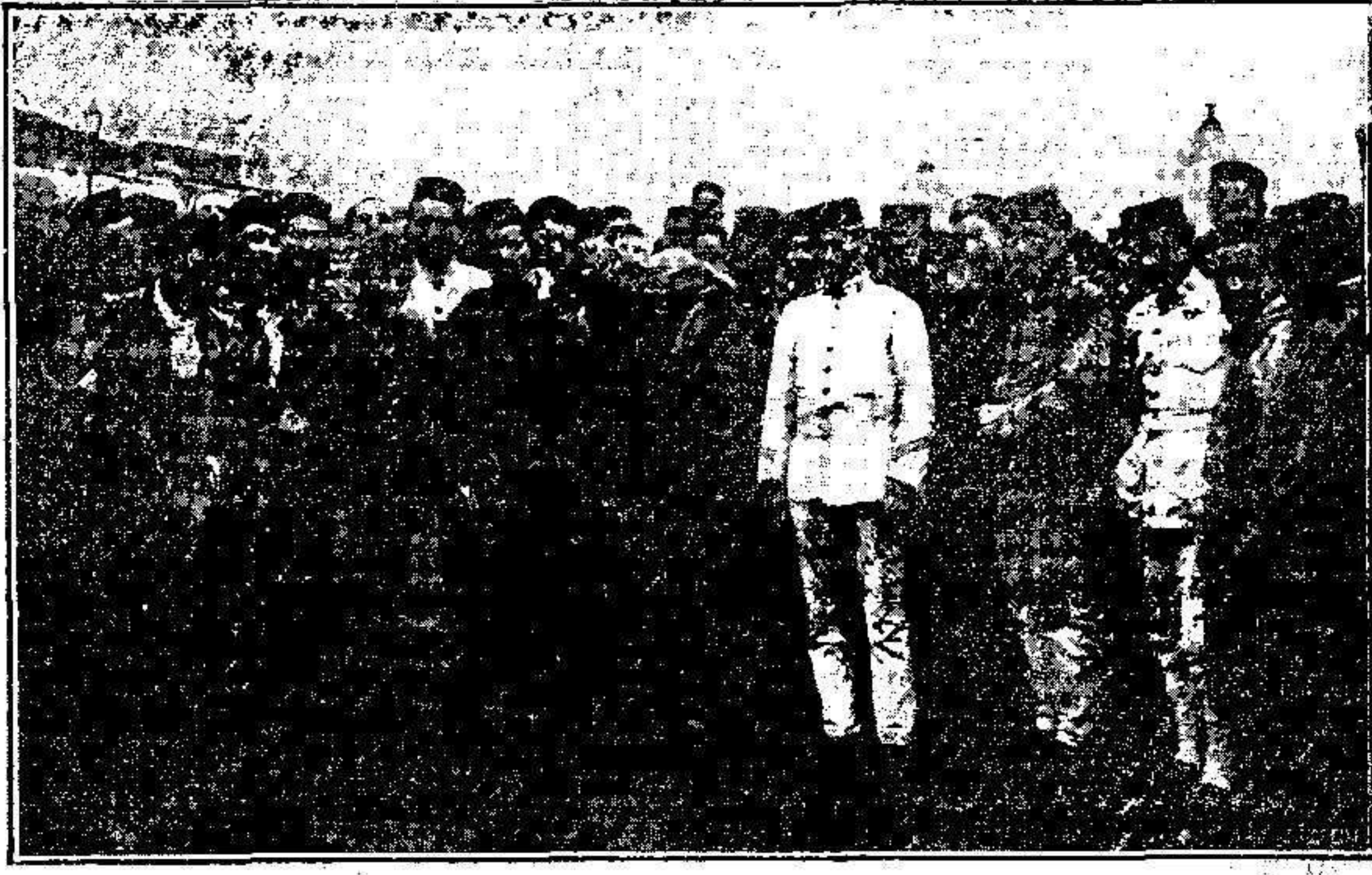
Conducción de un soldado herido en Tetuán