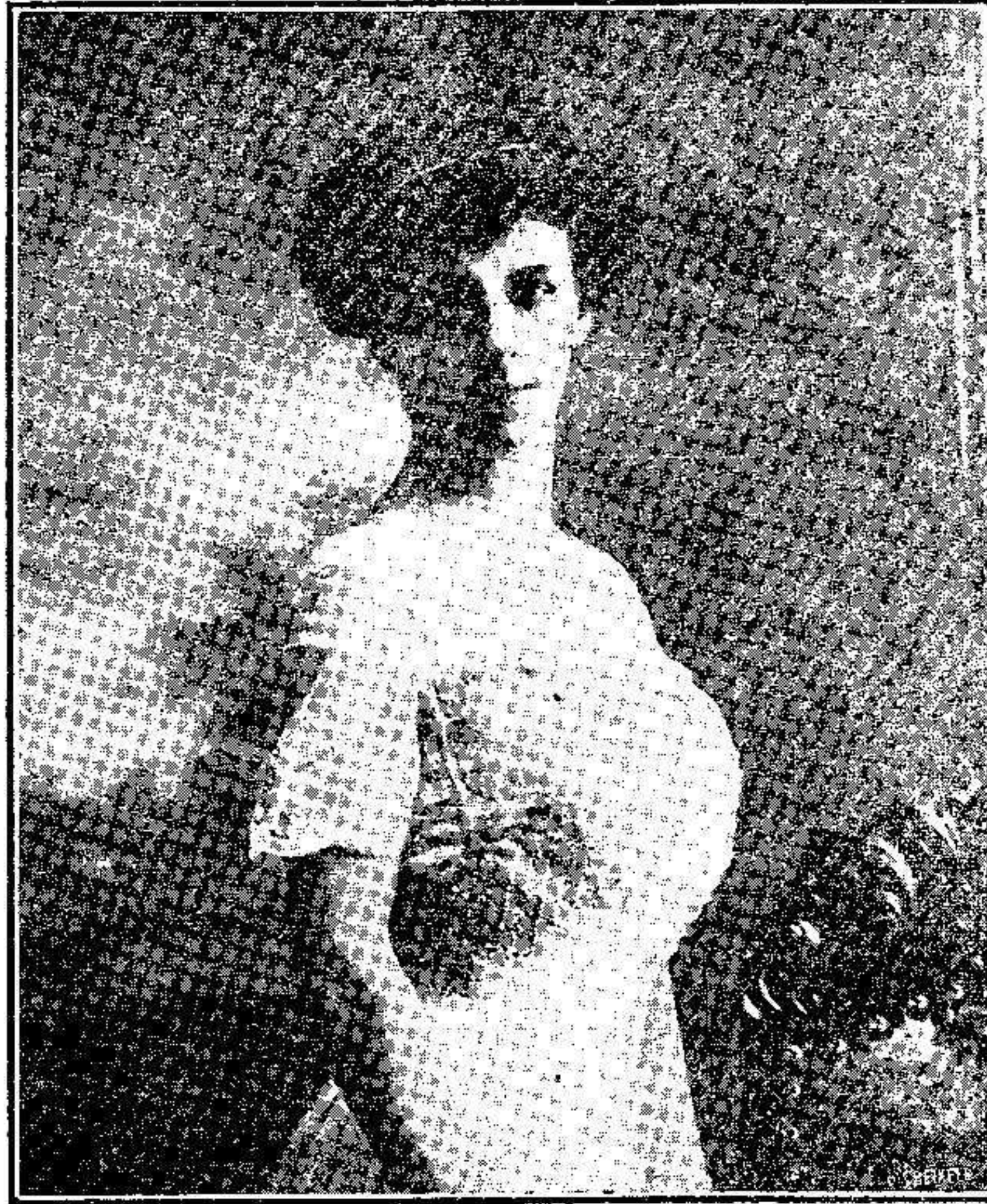
La condesa Matilde Calvi di Bergole, que acaba de contraer matrimonio con el príncipe Ange de Dinamarca.

Los alumnos saltarán á tierra, recorriendo la población.